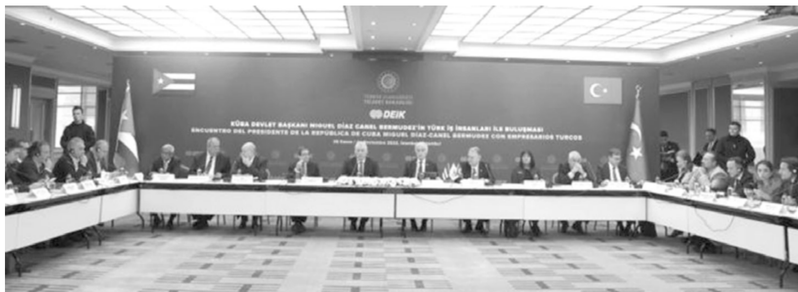
„Wir sind sehr an den Investitionen türkischer Geschäftsleute in Kuba interessiert“, sagte Díaz-Canel

Er erläuterte, dass der Privatsektor und die Genossenschaften stärker einbezogen würden, um die Rolle der kubanischen Staatsunternehmen zu ergänzen, die sich in einem Prozess der Perfektionierung befänden, um ihre Effizienz zu