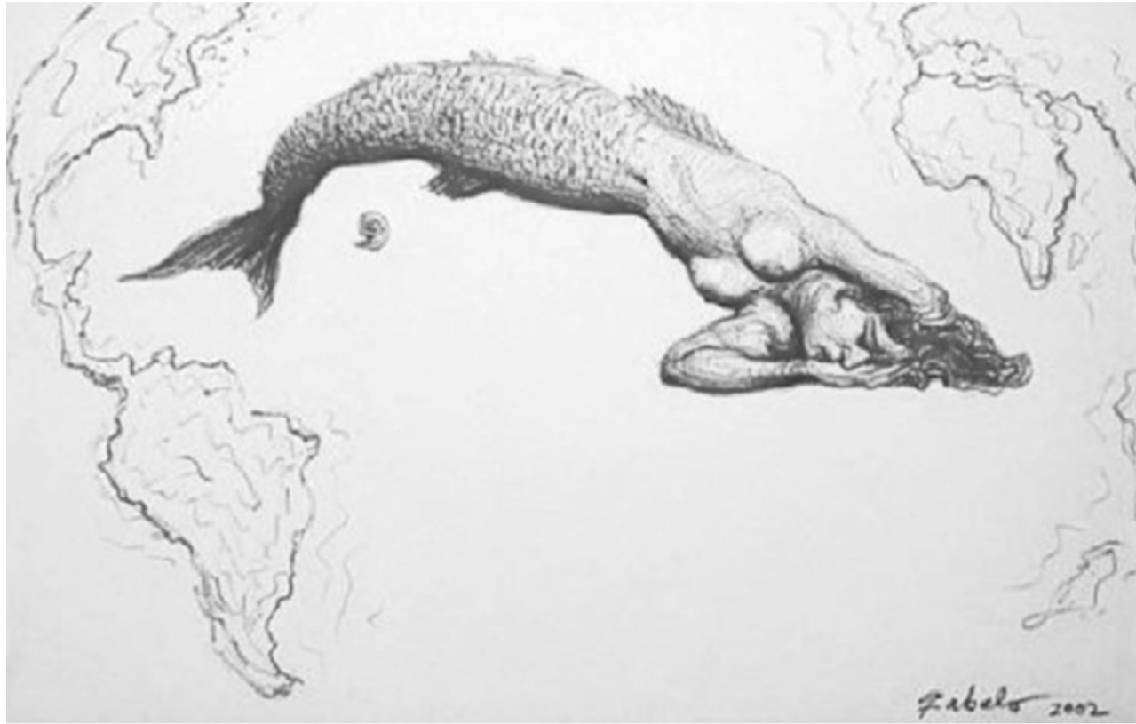
FOTO: OBRA DE ROBERTO FABELO

Den kubanischen Kindern wird auch beigebracht, selbst wenn einige dies wieder verlernen oder als Erwachsene versuchen, es zu vergessen, dass Kuba bis 1959 ein Land war, das nur eine einzige