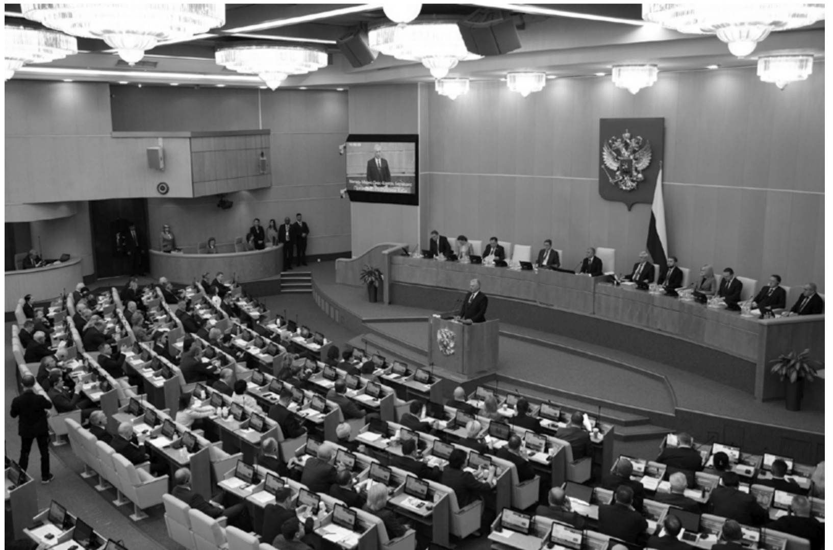
Die parlamentarischen Beziehungen zwischen Russland und Kuba stellen einen wichtigen Pfeiler der bilateralen Beziehungen dar

In dieser schwierigen Situation kann Kuba auf die Unterstützung und das Verständnis seiner engsten Freunde zählen, zu denen auch die Russische Föderation und natürlich die Abgeordneten dieser gesetzgebenden Körperschaft gehören, die eine grundlegende Rolle bei der Förderung wichtiger Projekte im wirtschaftlichen Bereich spielen können (Beifall).