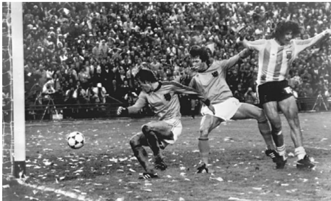
Mario Alberto Kempes, rechts, feiert eines seiner Tore im Finale der Fußballweltmeisterschaft 1978 gegen die Niederlande

Es war das erste Mal, dass die Forderungen der Mütter der Plaza de Mayo gehört