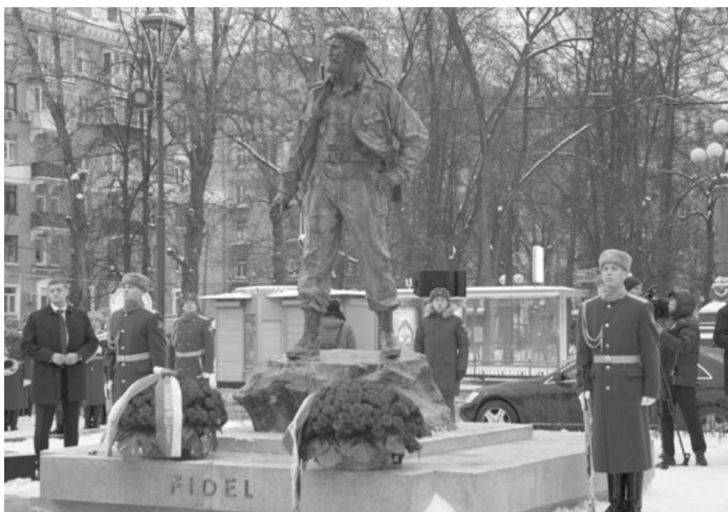
Die Symbolik des Bildes des nach vorne blickenden Comandante en Jefe in seinem Kampfanzug ist beeindruckend

Díaz-Canel Bermúdez wurde am 21. November vom Vizepräsidenten des