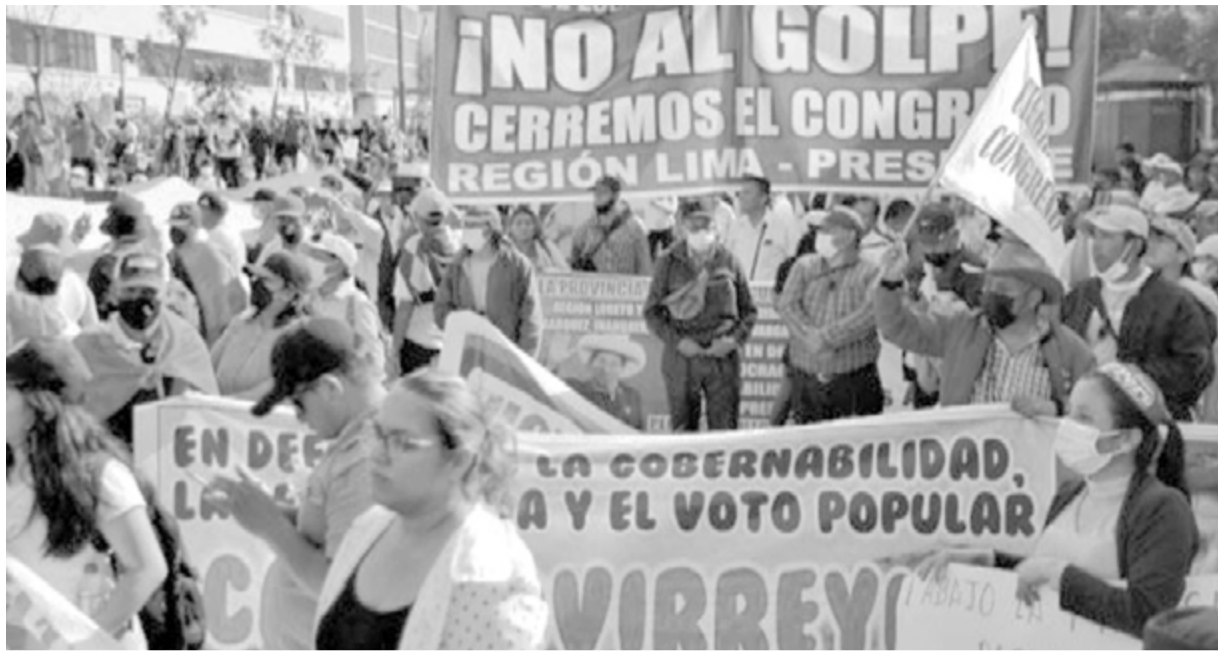
Demonstrationen für oder gegen den Antrag überschatten die politische Landschaft in Peru