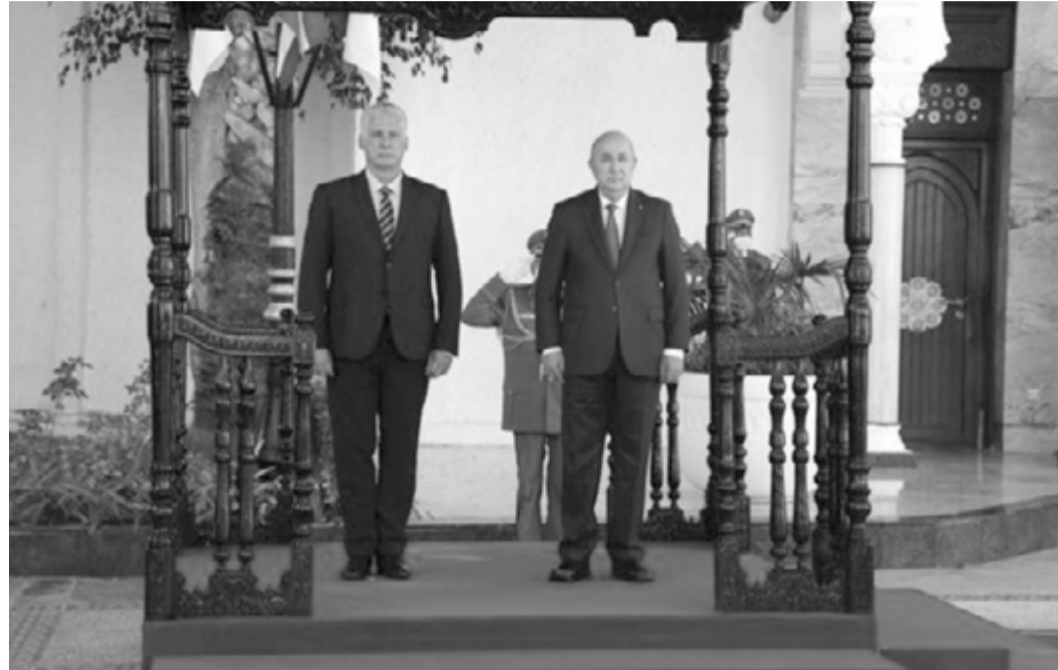
„Wir sind mehr als zufrieden, wir sind der algerischen Sache, der algerischen Regierung und dem algerischen Volk sehr verpflichtet“

Wie der Präsident gegenüber der Presse erklärte, wurde außerdem über eine gemeinsame Arbeit im Bereich der Zuckerproduktion gesprochen, und er fügte hinzu,