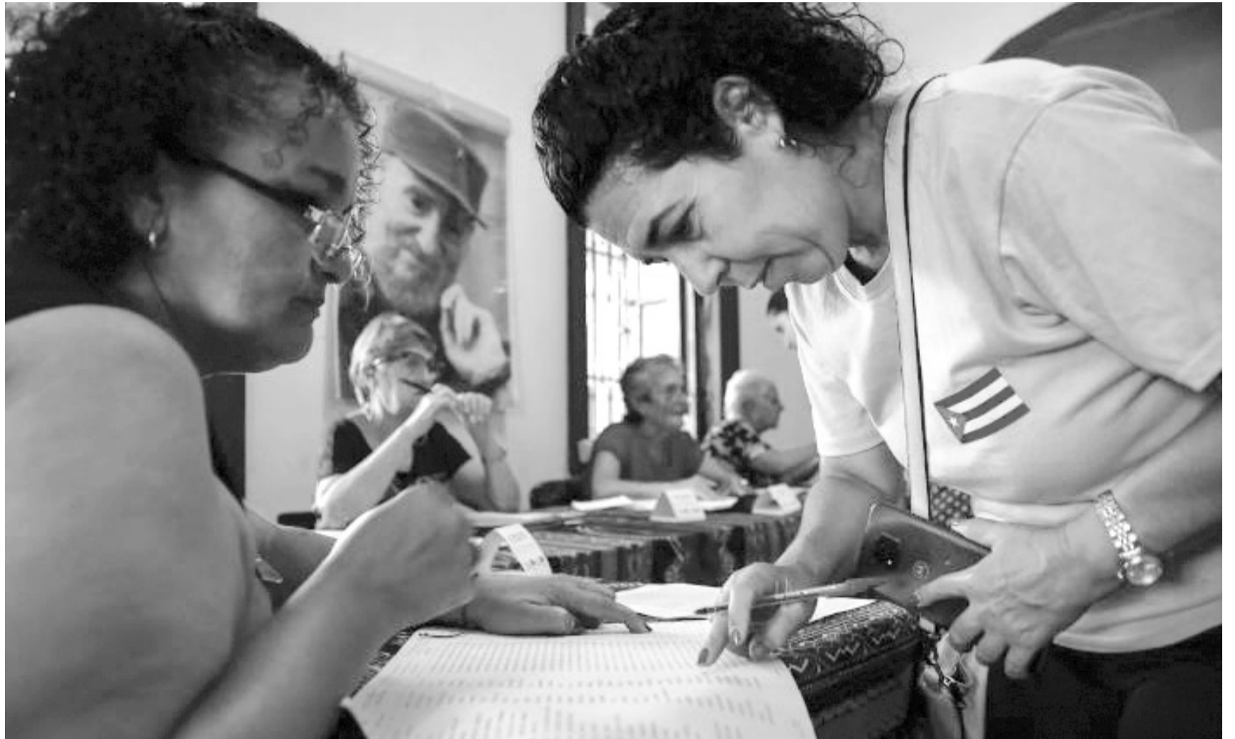
Verschieden Persönlichkeiten unseres Landes bezeichneten diesen Wahltag als historisch, da trotz der schwierigen Lage die Mehrheit der Kubaner ihr Vertrauen in das politische System und das Wahlsystem bekräftigt hat.

Der Präsident der Nationalversammlung der Volksmacht, Esteban Lazo Hernández, erinnerte nach der Ausübung seines Wahlrechts an Fidel Castro Ruz, den