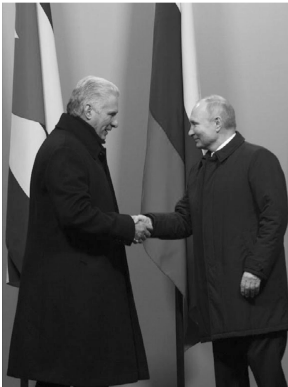
Der Erste Sekretär der Partei sprach von gemeinsamen Vorstellungen zu den imperialistischen Ambitionen, der Notwendigkeit, die Multipolarität zu verteidigen, und anderen Themen sowie von seiner Bewunderung für die tiefgreifende Analyse der Geschichte durch Präsident Wladimir Putin

„Für uns ist dieser Besuch von großer Bedeutung, da wir ihn in einer Zeit machen, in der beide Länder, Russland und Kuba, ungerechten und willkürlichen