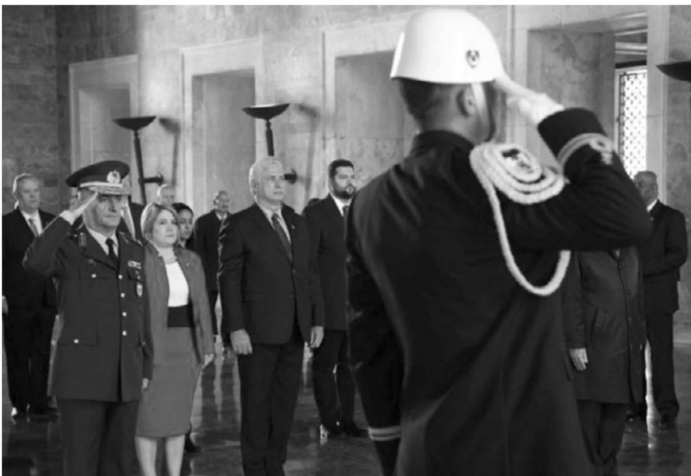
Präsident Díaz-Canel zollte Kemal Atatürk, dem Gründer der türkischen Republik, Tribut

Der Präsident erläuterte, dass er bei seinem Empfang durch Präsident Erdogan diesem „im Namen unseres Volkes für die von uns geschätzte Unterstützung durch die Forderung Türkiyes nach Beendigung der von den Vereinigten Staaten gegen Kuba verhängten Wirtschafts-, Handels- und Finanzblockade gedankt hat“.