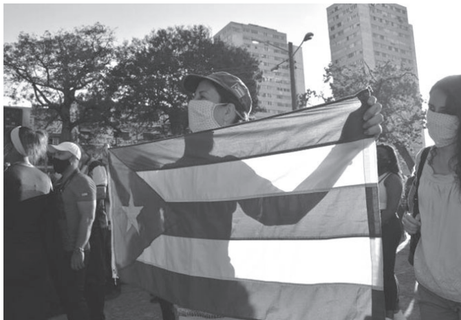
Der 8. Parteitag wird inmitten einer großen Unterstützung des Volkes für unser Gesellschaftsmodell ausgetragen.

Reden von Fidel und Raúl an den Parteitag der PCC Thesen und Resolutionen, die auf den verschiedenen Parteitag verabschiedet wurden. Die vom Presseinformationzentrum erstellten Zusammenfassungen über die Parteitage •