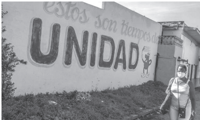
Unsere Partei steht vor einem weiteren bedeutenden Moment ihrer Geschichte

der Debatte nahmen sechseinhalb Millionen Kubaner teil.