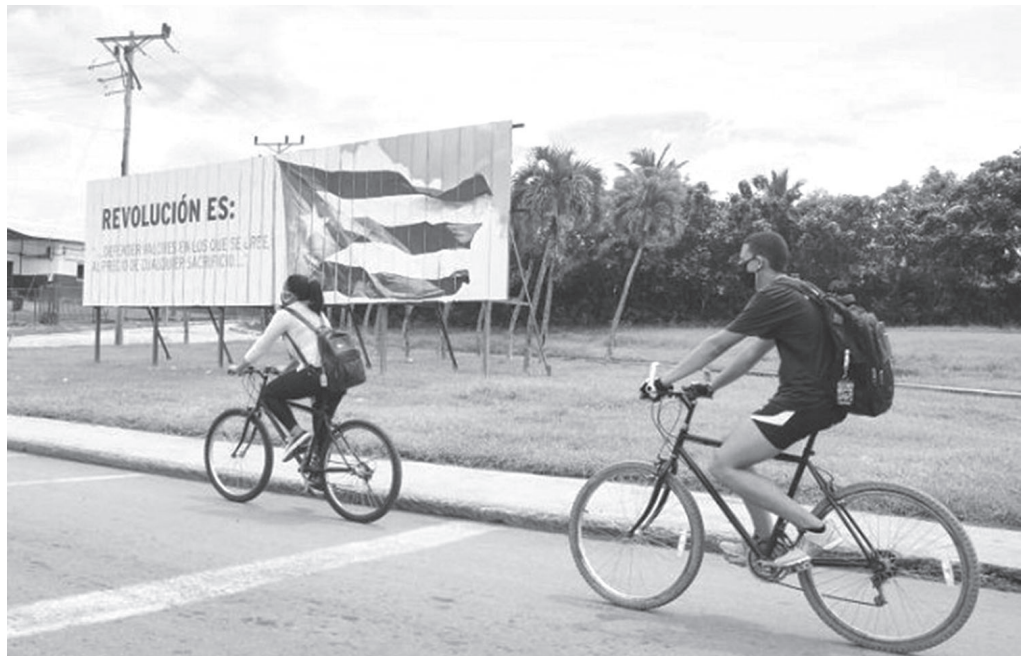
Nichts ist der Partei fremd, was mit der Gegenwart und Zukunft des Landes zu tun hat