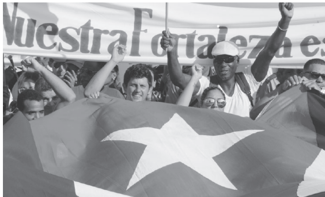
Unsere Partei ist einzigartig, weil sie die Partei des Volkes für das Volk ist

In einer Welt äußerster Verwundbarkeit und sozialer Loslösung, in der jeder gezwungen ist, persönliche Lösungen angesichts einer systemischen Krise zu suchen, hat sie uns Macht gegeben. In Hochrisikogesellschaften dominiert das „Rette dich wer kann“. Wer daran zweifelt, sollte wissen, dass über 55 % der Weltbevölkerung, 4 Milliarden Menschen, während dieser Periode der humanitären Krise, die wir erleben, über keinerlei Form von sozialem Schutz verfügen. 1,3 Milliarden sind multidimensional arme, d.h. sie sind nicht nur arm wegen ihres geringen Einkommens, sondern auch deshalb, weil sie aus den Gesundheits- und Bildungssystemen, dem Zugang zu Trinkwasser und von anderen Rechten ausgeschlossen sind. Die Hälfte von ihnen, 662 Millionen, sind Kinder.