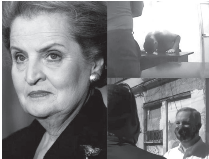
Madeline Albright, die die Bombardierung Jugoslawiens rechtfertigte, heuert auch Provokateure und Söldner in Kuba an und bezahlt jene, die außerdem vom Geschäftsträger der US-Botschaft auf dem Archipel unterstützt werden.

So lesen wir, wie der antikolonialistische Kämpfer und Verteidiger der Armen, Herr Luis Almagro, seine Unterstützung für seinen Kollegen erklärt, der als Angestellter der US-Regierung behauptet, im Hungerstreik zu sein, während das kubanische Fernsehen zeigt, wie er heimlich reichlich Nahrung erhält. Almagro, der weiß, dass seine Arbeitgeber die Väter des Staatsterrorismus auf dem ganzen Planeten sind, spricht in Bezug auf seinen Kollegen vom „Staatsterrorismus“ der kubanischen Regierung, zufälligerweise am Vorabend der Veröffentlichung eines Berichts durch das Außenministerium, in dem Kuba ohne jeden Beweis der Folter und außergerichtlicher Hinrichtungen beschuldigt wird, während er diejenigen unterstützt, die jungen Chilenen die Augen ausschließen und soziale Kämpfer in Kolumbien mit erschreckender Häufigkeit ermorden. Dass dies von der Regierung getan wird, deren Präsident der zweite Befehlshaber einer Exekutive war, die ein gesetzloses Gefängnis in Guantánamo offen hielt, ferngesteuerte Ermordungen durch Drohnen einleitete und gleichzeitig als Tribunal und Henker fungierte, und dessen Außenmi-