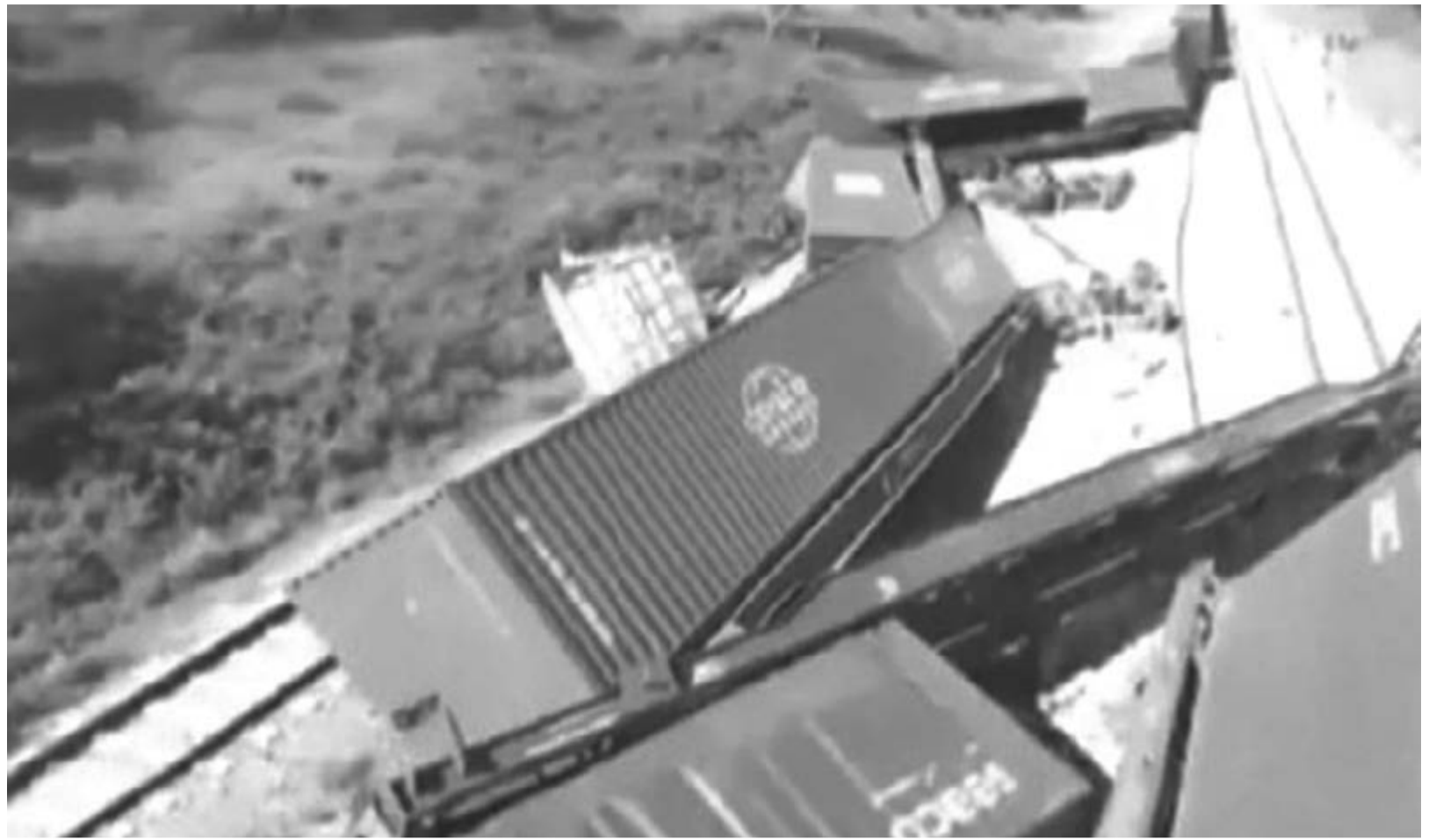
Zu den im Programm angeklagten Vandalen gehören die vier Schuldigen an der Entgleisung eines vom Container-Terminal Mariel kommenden Güterzugs am 26. Mai 2019

Ihre eigenen Veröffentlichungen in den sozialen Netzen verweisen auf eine