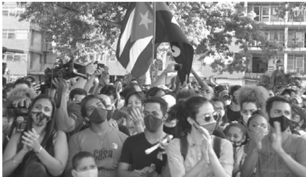
Die spontane Demonstration zur Verteidigung der Revolution im Trillo Park ist eine Erfahrung, die die jungen Leute niemals vergessen werden

Mit denjenigen, die die historische Legitimität der Revolution anerkennen und akzeptieren