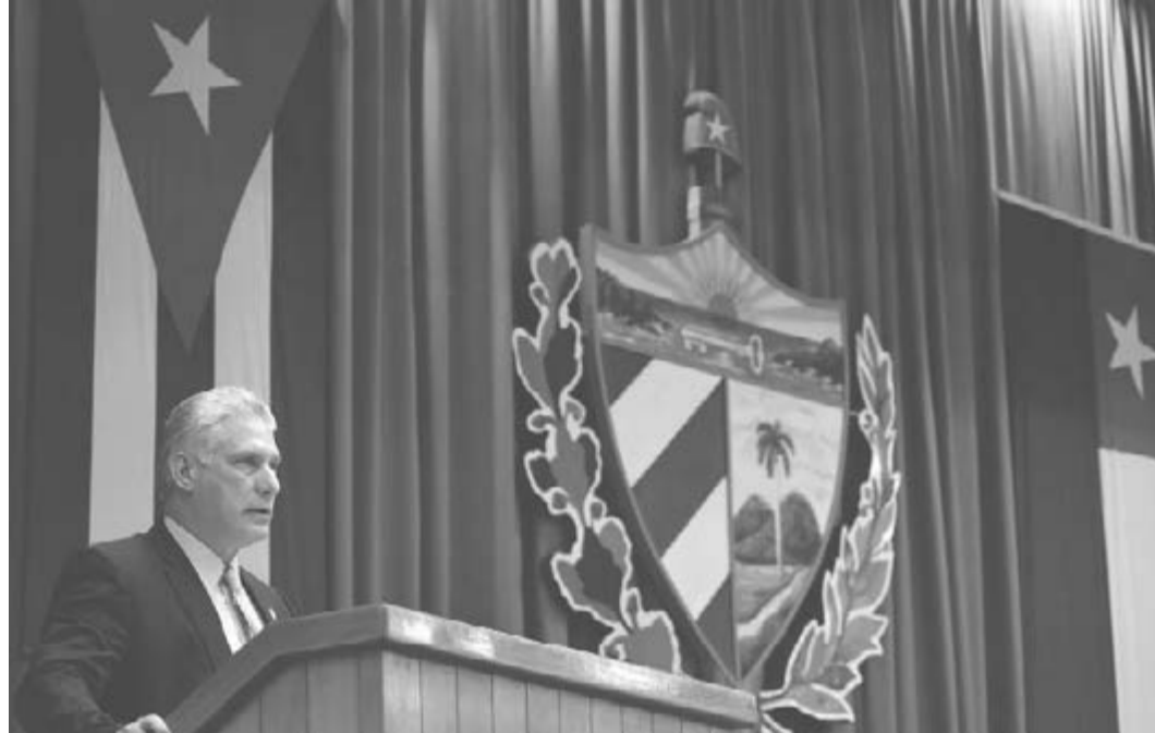
Díaz-Canel: Sie waren entschlossen uns zu töten; aber wir bestanden darauf zu leben und zu siegen: das lebendige Kuba übertraf seine eigenen Möglichkeiten

Ich möchte hier und heute sagen, dass jede Stunde dieser Monate der Konfrontation mit COVID-19 ein Wachsen und Ler-