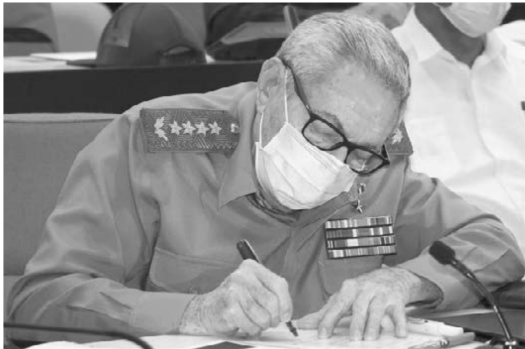
Die Söhne und Töchter der Revolution haben zusammen mit unserem Volk die Pflicht und die Ehre, der Geschichte, die uns bis hierher gebracht hat, Kontinuität zu verleihen

Die Herausforderung der Periode, über die wir sprechen, war größer als zu jedem anderen Zeitpunkt, da wir im selben Jahr der Pandemie und der Verschärfung der