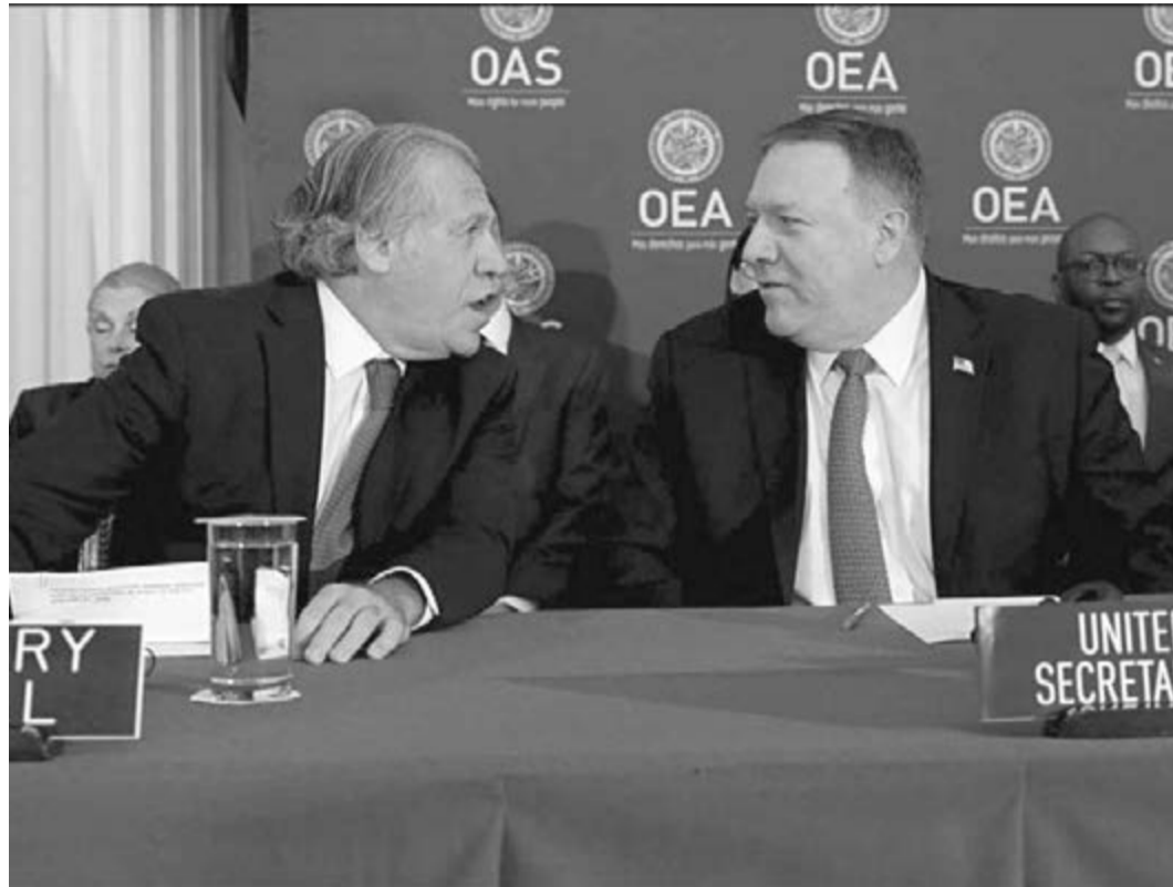
OAS-Generalsekretär Almagro und US-Außenminister Pompeo in bestem Einvernehmen

Einige Tage vor den Drohungen Pompeos und dem Antrag des Kongressabgeordneten Sires hatte der OAS-Generalsekretär Luis Almagro die Kampagne der Anschuldigungen gegen die sandinistische Nation inspiert und war sogar so weit gegangen, von Präsident Ortega zu fordern, das in diesem Land demokratisch verabschiedete „Gesetz zur Verteidigung der Rechte des Volkes auf Unabhängigkeit, Souveränität und Selbstbestimmung für den Frieden“ aufzuheben.