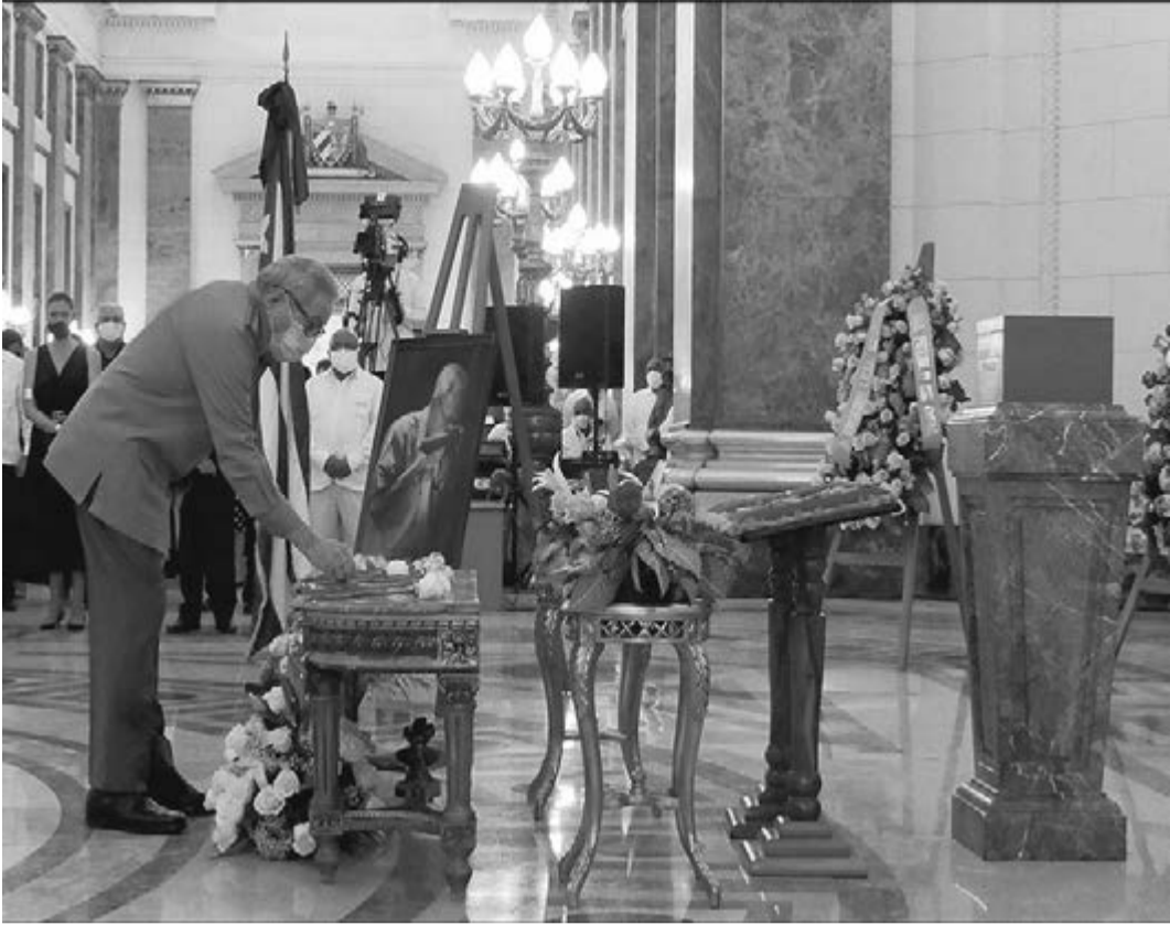
Raúl, Díaz-Canel, Lazo, Marrero, Valdés Mesa und ein großer Teil der Staats- und Regierungsführung Kubas legten an der Grabstelle des geliebten Historikers Rosen nieder