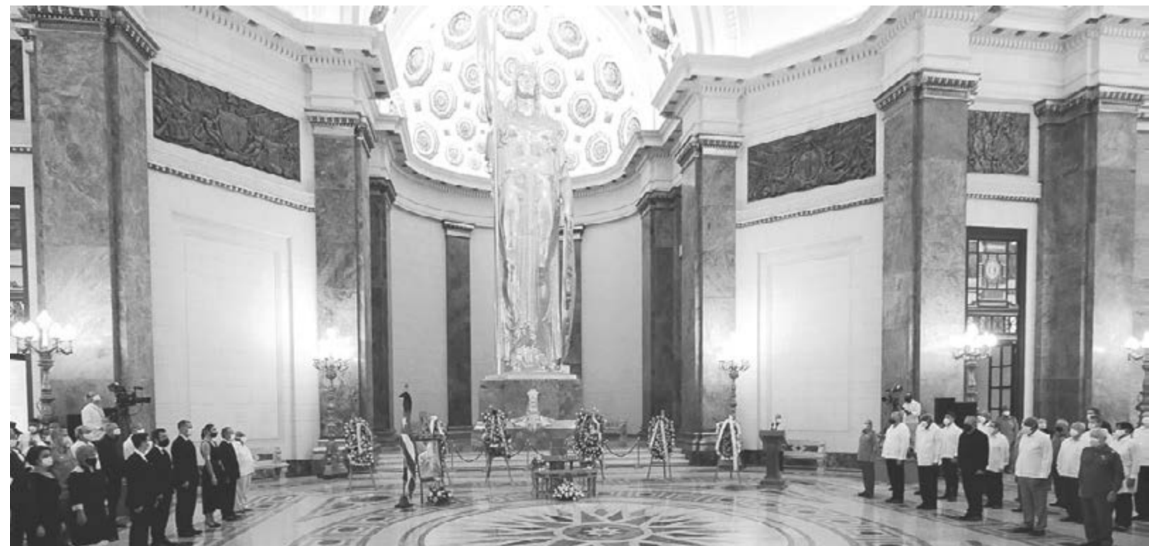
Eusebio war ein Botschafter der Wahrheit Kubas, der Wahrheit der Revolution

An diesem schlichten Ort, zu dem man Erde aus Jimaguayú, San Lorenzo, Dos Ríos, San Pedro und Birán gebracht hatte, wird Eusebio präsent sein, um die noble und würdige Zukunft Havannas zu markieren, der Stadt, die er so liebte. •