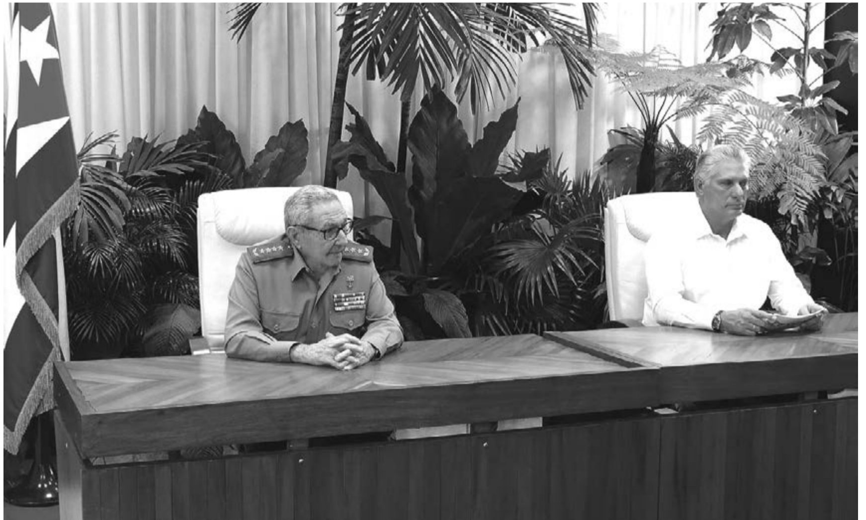
Der Präsident der Republik informierte in Anwesenheit des Armeegenerals Raúl Castro Ruz, darüber, dass die monetäre Neuordnung mit einem einheitlichen Wechselkurs von 24 kubanischen Pesos für einen Dollar durchgeführt werde.

Gleichzeitig wurde das Thema in den verschiedenen Pressemitteln ausführlich behandelt.