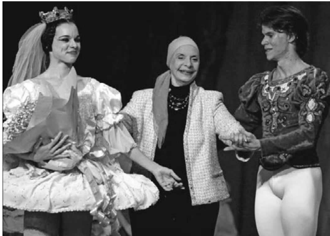
„Die einfachste Bewegung kann sich in einen Tanz verwandeln, wenn man ihr einen Sinn, ein Warum verleiht“, lehrte Alicia ihre Schüler in der Kubanischen Ballettschule

Körper und den muss er mit der Technik kultivieren, denn je besser er ihn beherrscht, um so reicher ist sein Vokabular, umso größer ist seine Fähigkeit, mit dem Publikum in Verbindung zu treten, aber das kann man nur mit Arbeit und Disziplin erreichen. Der Tänzer, der sie nicht beherrscht, ist stumm. Die Technik ist nichts Mechanisches. Du musst sie verinnerlichen, denn in dem Moment, in dem du auf der Bühne tanzst, darfst du nicht an sie denken, musst du sie vergessen, denn wenn du das nicht tust, verwandelst du dich in einen Sportler, aber nicht in einen Künstler.