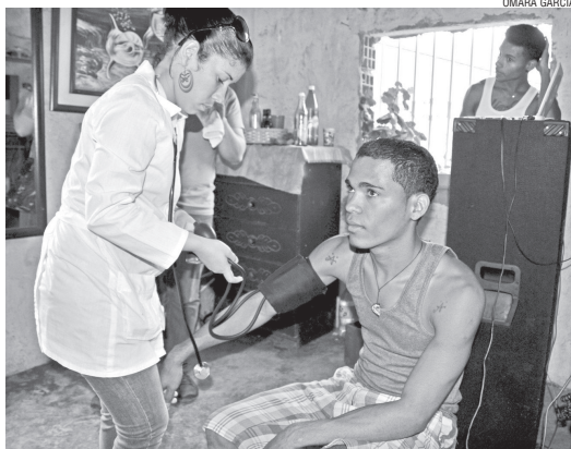
Donald Trump möchte das Werk der Liebe der 600.000 Kubaner schlecht machen, die in den letzten 55 Jahren unter dem Banner der Revolution in über 160 Ländern medizinische Dienste geleistet haben

Trump möchte auch nach 2021 weiter regieren und seiner Kampagne zu einem guten Start verhelfen. Da ist nichts einfacher als vor dem Teil der Wählerschaft Floridas, die für jedes Versprechen für einen Angriff auf das Land ihrer Herkunft, selbst Beelzebub persönlich seine Stimme schenken würde, aufzutrompfen. Also begann er vor kurzem genau in Orlando seine Kampagne und rührte die alten Gespenster der kommunistischen Bedrohung mit der erklärten Hoffnung wieder auf, dass seine Anstrengungen an den Urnen belohnt würden, wenn ihm diese vom Präsidenten so umworbene Minderheit dabei hilft.