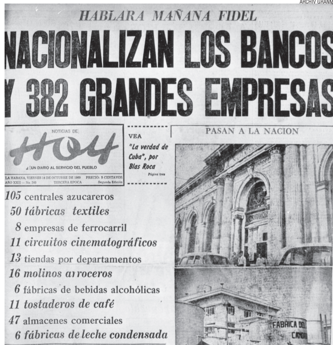
Entsprechend dem Programm der Moncada erließ die Revolutionäre Regierung zum Wohle der Allgemeinheit die Gesetze zur Verstaatlichung

Die Verstaatlichungen, als Handlungen des Staates, entsprechen dem souveränen Charakter desselben. Infolgedessen ist jeder Staat verpflichtet, die Unabhängigkeit der Vorgehensweise des jeweils anderen zu achten. Sie stellen Akte der wirtschaftlichen