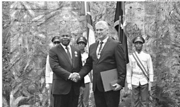
Der kubanische Präsident betonte unter den gemeinsamen Herausforderungen unserer Nationen die Verteidigung des Rechts auf Entwicklung, Wohlstand und soziale Gerechtigkeit und die Wahrung des Friedens und der internationalen Sicherheit