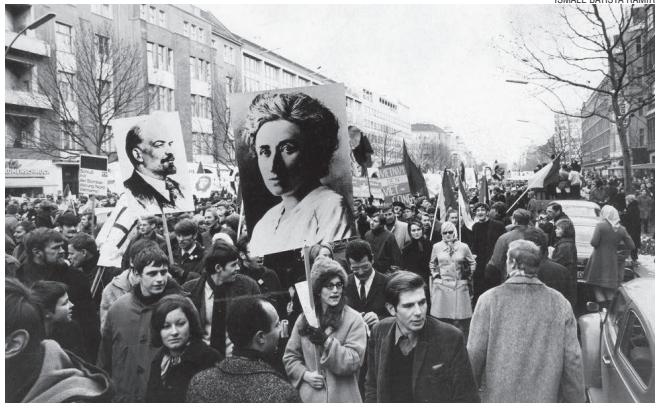
Die Rose wurde ausgerissen, aber nicht die Hoffnung

Für Rosa bedeutete damals die nationale Frage einen Rückschritt und ihre Einschätzungen gründeten auf der Notwendigkeit, die konspirative sozialistische - und Arbeiterbewegung zu internationalisieren, um auf diese Weise schnell die Emanzipation der unterdrückten Klassen zu erreichen. Als sie dann in Deutschland lebte, einem Land, das seine Stärke aus der von Bismarck errichteten Einheit schöpfte, kam sie zu der Überzeugung, dass die Nationalisten nur Rückschritte auf dem Weg zu einer Revolution bewirken würden, die, angesichts