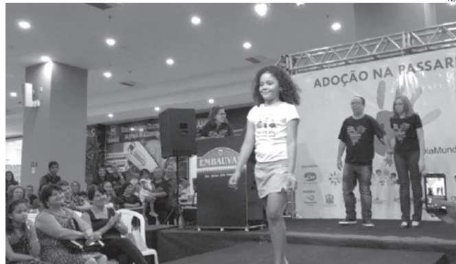
Im Brasiliens Bolsonaro's kann man bereits in ein Einkaufszentrum gehen und Schuhe, Taschen und Kinder kaufen

Ist es wirklich so, dass diese „Kinder ohne Zuhause“ sich gerne so öffentlich zur Schau gestellt haben? Hatten die Organisatoren gute Absichten? Wer weiß? Fakt ist, dass es um diesen Catwalk herum zu einer leidenschaftlichen Polemik in den sozialen Netzen gekommen ist. Einige verglichen ihn mit der Ausstellung von Tieren oder Skla-