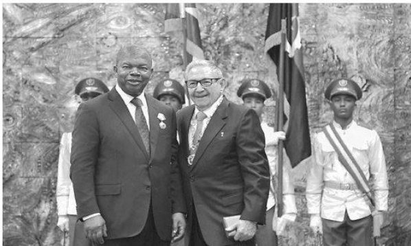
So wie eines Tages dem historischen Führer der kubanischen Revolution wurde nun für seine herausragende Verdienste dem Ersten Sekretär der PCC, Armeegeneral Raúl Castro Ruz, der Agostinho-Neto-Orden verliehen

Im Namen der Völker Kubas und Angolas wurden die Orden José Martí und Agostinho Neto verliehen