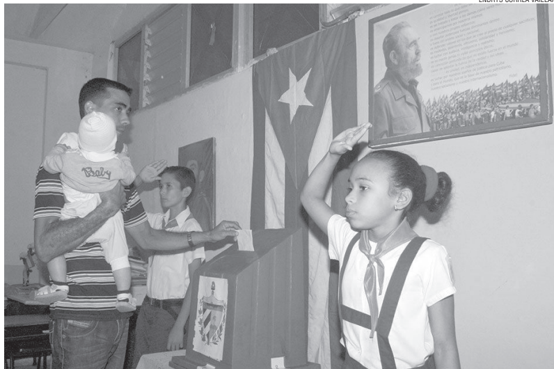
Ein Teil der in der Verfassung definierten neuen Staatsstruktur erfordert ein Wahlgesetz, das die Mechanismen zur Regelung und zur Garantie dieses Prozesses umsetzt

Es müsste auch am Wesen der Wahlen auf Gemeindeebene festge-