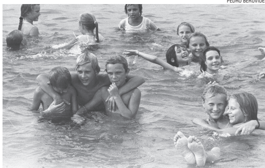
Von der Atomkatastrophe geschädigte Kinder beim Baden am Strand von Tarará als Teil ihrer Rehabilitation

José Martí, das mehr als drei Millionen kubanische Kinder durchlaufen hatten.