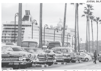
Stellen die Maßnahmen Trumps gegenüber Kuba etwa keinen Stolperstein für die Arbeit der 595.559 Personen dar, die im nicht-staatlichen Bereich arbeiten?

Fakt ist, dass das Interesse der US-Bürger, die Wirklichkeit des von ihrer Regierung verteuerten Landes kennen zu lernen, des