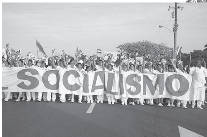
Wir sind auf dem Weg, den wir gewählt haben und verteidigen: zum Sozialismus

Es sind nicht die Raketen, es sind nicht die Armeen und auch nicht nur die Polizeikräfte, mit denen die Mächtigen die Herrschaft absichern; die Verteidigungskräfte des Kapitals befinden sich im Unterbewusstsein der Individuen und sie sind mächtiger als die modernste vom militärisch-industriellen Komplex entwickelte Waffe.