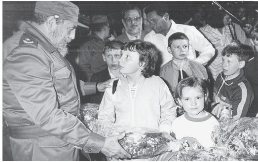
Fidel Castro empfängt am 29. März 1990 sowjetische Kinder aus Tschernobyl

Seit 1976 befand sich an diesem Ort das Internationale Pionierlager