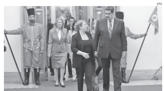
Präsident Maduro empfing UNO-Kommissarin Bachelet

Nach Abschluss des Besuchs schrieb Präsident Nicolás Maduro auf seinem Twitter-Account: „Unsere Priorität ist das Glück des venezolanischen Volkes,