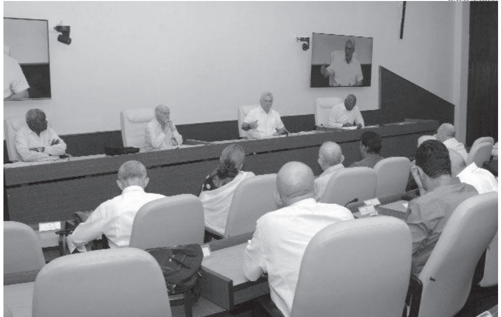
„Es ist nicht die endgültige Lohnerhöhung, die wir haben werden, aber sie ist sehr bedeutsam unter unseren gegenwärtigen Bedingungen“, betonte der Präsident

Als von grundlegender Bedeutung betrachtete er dabei die Rolle und Vorbereitung, die die Kader auf allen Ebenen benötigen. Außerdem betonte er, dass es unumgänglich sei, „die Änderungen vorzunehmen, die in den Institutionen des Landes anstehen, denn es sind Änderungen am Wirtschaftsmodell vorgenommen worden und im Grunde arbeiten wir weiterhin mit den gleichen institutionellen Strukturen“.