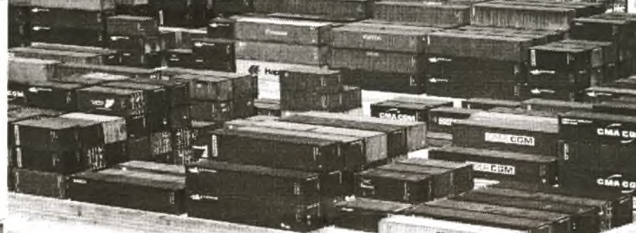
Ausblick eines Kranführers