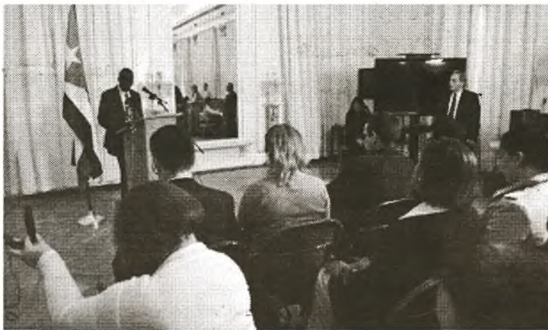
Pedro Luis Cuesta Pedroso, stellvertretender Direktor für multilaterale Beziehungen und Völkerrecht des Außenministeriums und Leiter der kubanischen Delegation, auf einer Pressekonferenz nach den Gesprächen, die im Außenministerium in Washington stattfanden

Unterdessen stimmte eine Pressemitteilung des US-Außenministeriums darin überein, die Arbeitsatmosphäre des Treffens als respektvoll zu bezeichnen, bei dem die US-Seite durch den Staatssekretär für Demokratie, Menschenrechte und Arbeit, Tomasz Malinowski, geführt wurde.