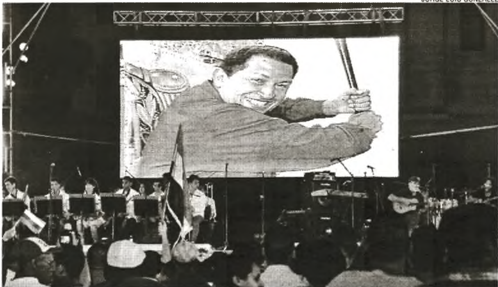
Konzert junger kubanischer Künstler in Unterstützung des Volkes und der Regierung Venezuelas, für Frieden, Gerechtigkeit und Einheit Lateinamerikas