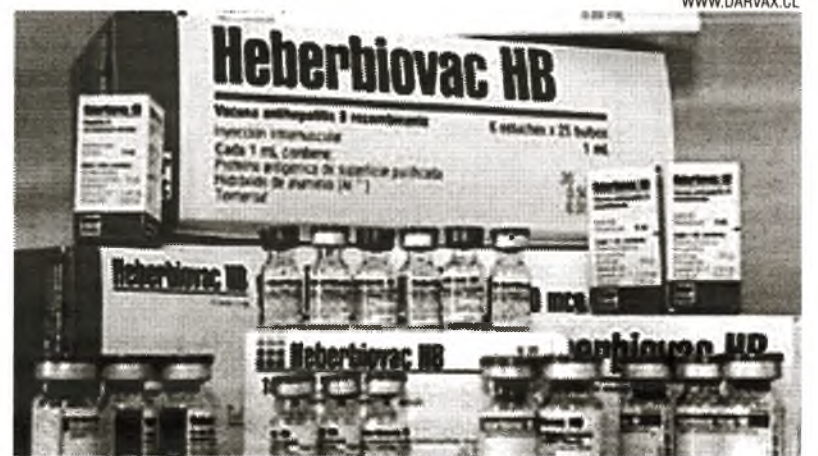
Der Impfstoff gegen Hepatitis B (Heberbiovac HB) wird verwendet, um die gesamte kubanische Bevölkerung unter 25 Jahren zu immunisieren und ist in über 35 Ländern Lateinamerikas, Europas, Asiens und Afrikas registriert

Andere wurden für ihre Einbeziehung in die Biotechnologie-Indus-