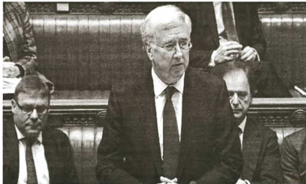
Der britische Verteidigungsminister Michael Fallon kündigte vor dem Unterhaus die militärische Aufrüstung der Falklandinseln an, mit der einer angeblichen Bedrohung durch Argentinien zuvorgekommen werden soll

Die diskursive Strategie Fallons ähnelt der, die zuvor von der Boulevardzeitung The Sun verkündet wurde. Darin hieß es, dass „das instabile Ar-