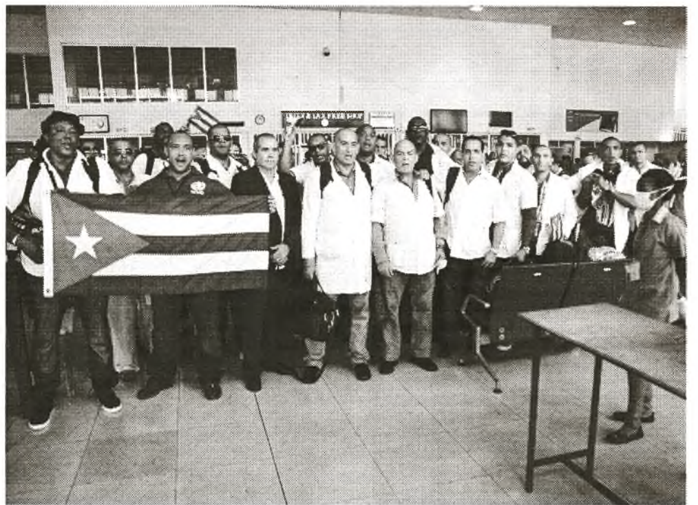
Kubanische Ärzte und Pfleger kurz vor dem Abflug aus Sierra Leone

Das zurückgekehrte Gesundheitspersonal befindet sich jetzt im Prozess der epidemiologischen Überwachung, der für alle Personen festgelegt ist, die aus Ländern kommen, die unter dieser Epidemie gelitten haben. (PL) •