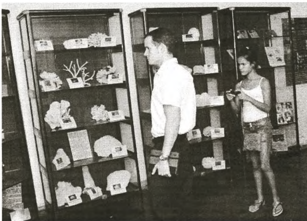
Weniger bekannt als andere Bereiche ist der Raum mit einer der größten Sammlungen von Meeresbewohnern Lateinamerikas