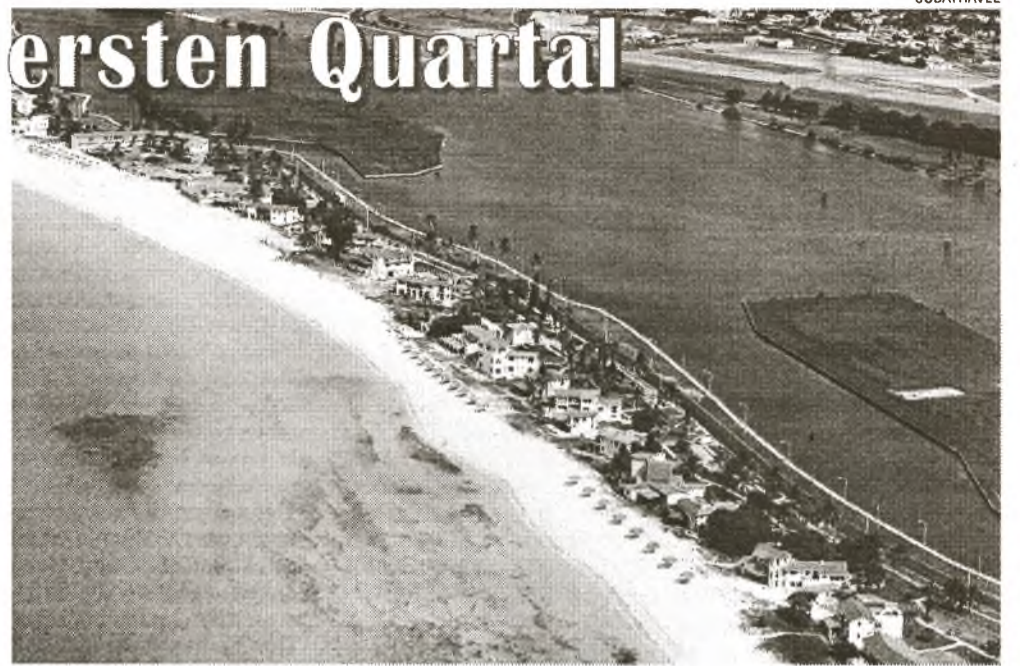
Luftaufnahme vom Badeort Varadero