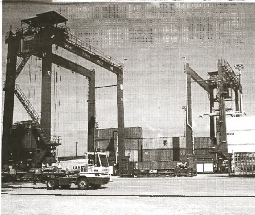
Das Terminal verfügt über moderne Kräne und andere Anlagen, die einen effizienten Betrieb ermöglichen