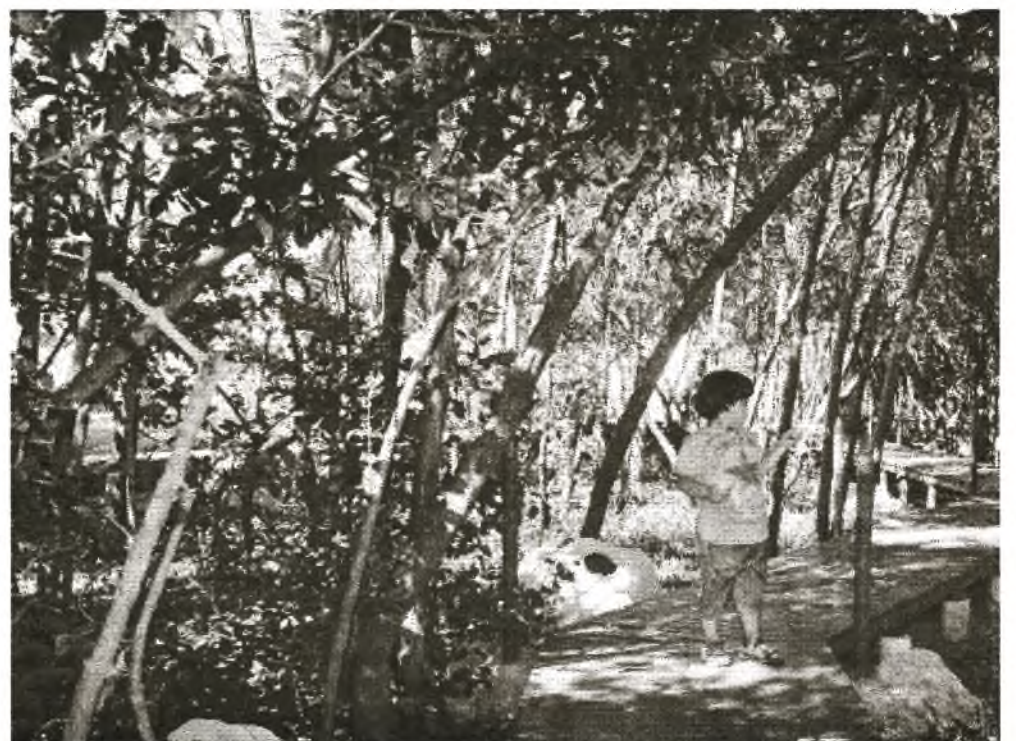
Die Arbeit der Fachleute hat es ermöglicht, drei Arten von Mangroven zu reproduzieren