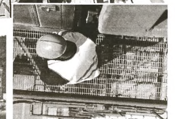
Ein Kranführer nimmt den Fahrstuhl, um sich an seinen Arbeitsplatz zu begeben. Pro Jahr sollen 822.000 20-Fuß-Container im Hafen abgefertigt werden