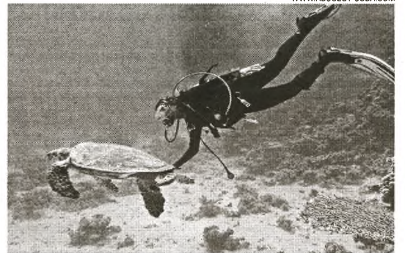
Den Tauchern stehen ausgezeichnete Tauchstellen zur Verfügung

sagte, dass das für sieben Tage und sechs Nächte konzipierte Tourismus-Paket zu Sonderpreisen Unterkunft, Verpflegung, Transport und sechs Tauchgänge umfasse.