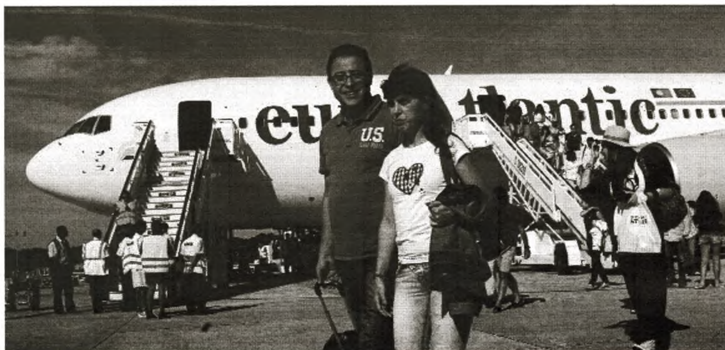
Ankunft von Touristen auf dem Flughafen von Cayo Coco

Coupon an: GNN Verlag Venloer Str. 440 (Toskana-Passage) 50825 Köln Tel.: 0221-21 1658