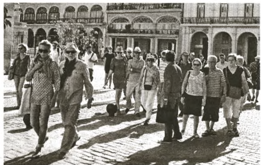
Eine Gruppe von Touristen besichtigt die Plaza Vieja in Alt-Havanna