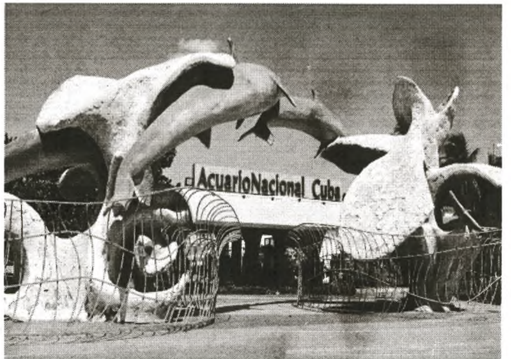
Das Aquarium pflegt über den Erfahrungsaustausch beim Training mit Meerestieren und Gewässerkunde Beziehungen zu gleichartigen Einrichtungen