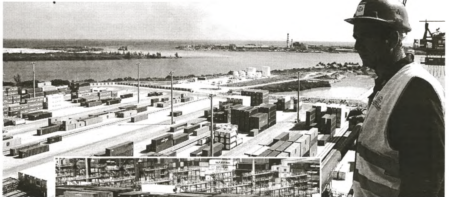
Das neue Hafenterminal nimmt bereits 250.000 20-Fuß-Container auf