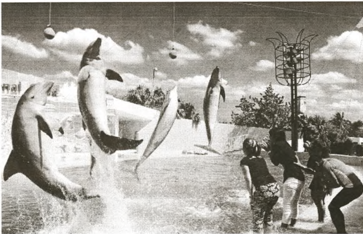
Eine der größten Attraktionen des Aquariums ist die Vorführung der Kunststücke von Seelöwen und Delfinen