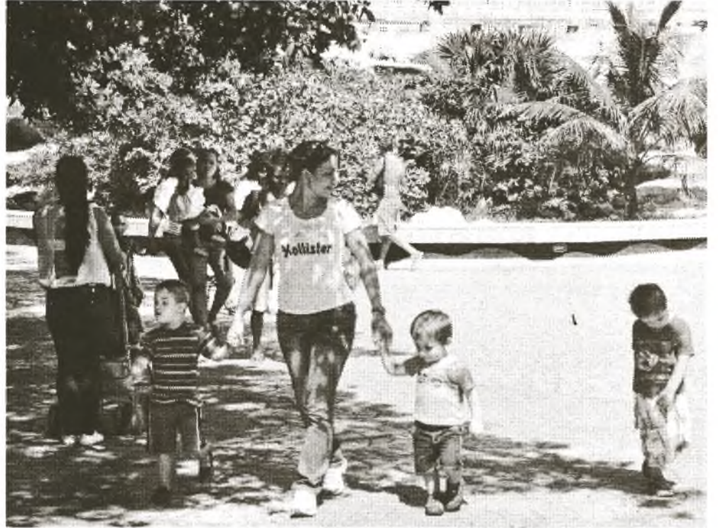
In den Sommermonaten empfängt das Aquarium mehr als 4.000 Besucher pro Tag

standhaltungsarbeiten an den alten zu vernachlässigen, die schon 55 Jahre alt sind“, erzählt uns Sabatel Pérez.