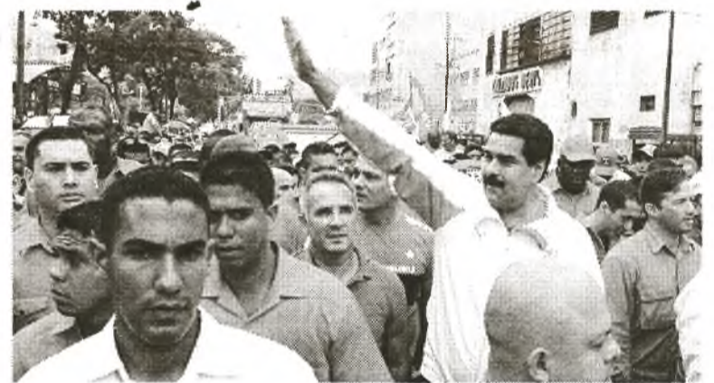
Die Mehrheit des venezolanischen Volkes unterstützt die Regierung des Präsidenten Nicolás Maduro

Der geopolitische Übergang zu einer multipolaren Welt behagt dem Außenministerium der USA ganz und gar nicht und es weiß nicht, wie es seine unipolare Hegemonie zurückerobern kann. Gerade Venezuela war das Land, das Ende des 20. Jahrhunderts in Lateinamerika als erstes einen anderen Weg einschlug als den, der vom Norden vorgegeben wurde, und das hatte einen Domino-Effekt auf dem ganzen Kontinent. Von diesem Augenblick an, nachdem Chávez 1998 die Wahlen gewonnen hatte, hat es keinen Wahlsieg der Parteien gegeben, die in Opposition zu den neuen Prozessen der Veränderung in Lateinamerika ste-