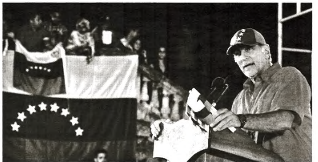
René González Schwerert, Held der Republik Kuba, bekräftigte die Unterstützung für die Bolivarische Revolution Venezuelas

Knie zwingen kann. Bei aller Freude, sagte er, sei ihnen immer das, was der Che einst lehrte, präsent gewesen: Dem Imperialismus darf man nicht trauen, kein bisschen.