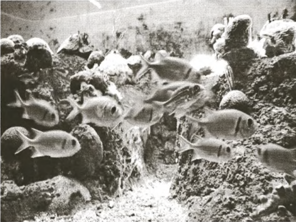
Das Aquarium hat verschiedene Unterwasserwelten nachgestaltet