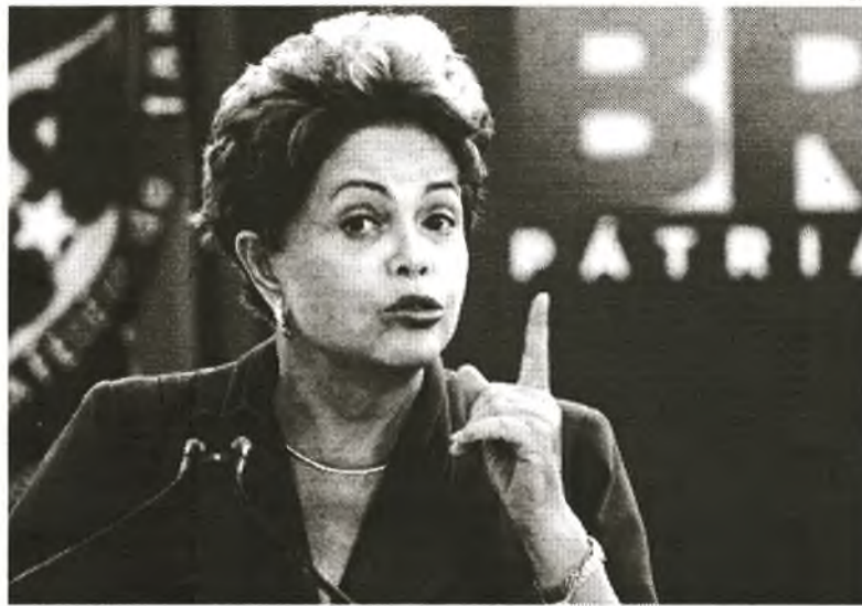
Die brasilianische Präsidentin Dilma Rousseff hat neue Maßnahmen gegen Korruption und Straflosigkeit angekündigt

Ein Punkt, den Dilma vorantreiben will, ist eine tief greifende politische Reform, die es unter anderem Unternehmen verbietet soll, Kandidaten sowie politische Parteien im Wahlkampf zu fi-