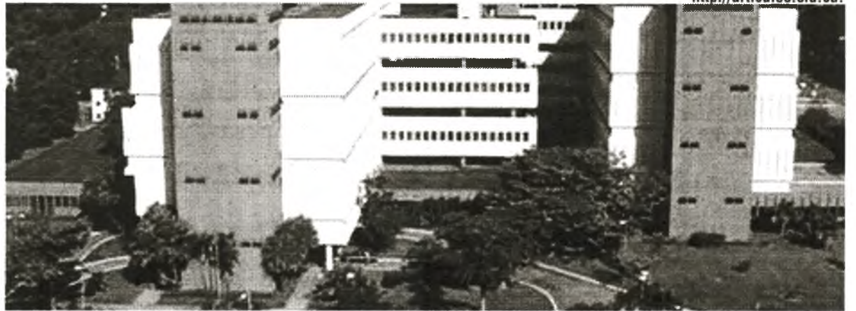
Am 1. Juli 1986 wurde das Zentrum für Gentechnik und Biotechnologie (CIGB) eingeweiht

Das Anwendungsspektrum der Biotechnologie ist breit und ihre Entwicklungsperspektiven unabsehbar. Ihre Ergebnisse werden derzeit in vielen Bereichen angewendet: in der Arzneimittelproduktion, in der Entwicklung neuer Therapien für die Behandlung von verschiedenen Krankheiten wie Krebs, Hepatitis B, Meningoenzephalitis oder HIV, sowie in der Agrar- und der Nahrungsmittelindustrie, der Landwirtschaft, in der chemischen und der Energieindustrie und sogar in der Computerindustrie, wo