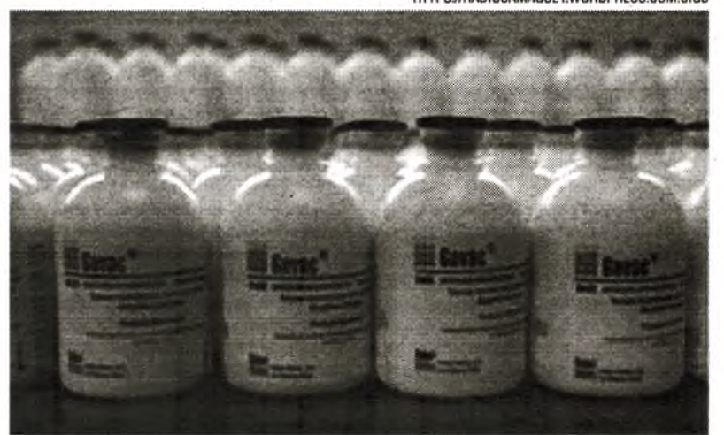
Der rekombinante Impfstoff gegen Zecken (Gavac) ist ein weiteres Produkt des Zentrums für Gentechnik und Biotechnologie. Seine Anwendung hat die Inzidenz und Mortalität durch Krankheiten, die durch diese Milbe auf Rinder übertragen werden, deutlich reduziert

trie umgebaut und erweitert, darunter das Institut für Tropenmedizin Pedro Kouri (IPK) und das Finlay-Institut.