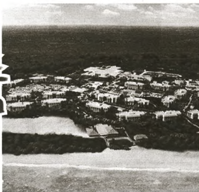
Meliá Jardines del Rey, Austragungsort von FITCuba 2015