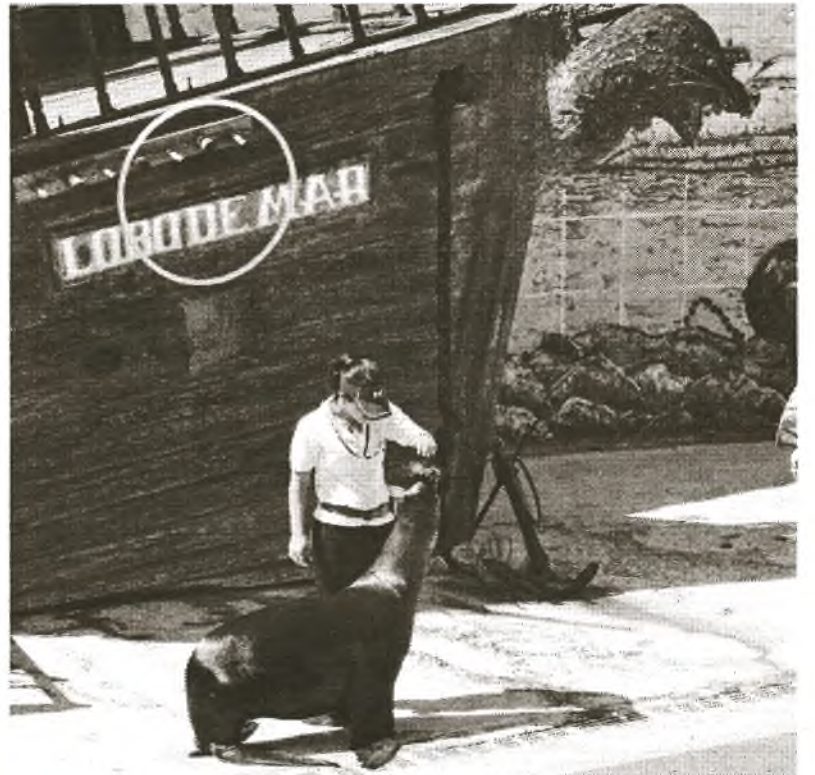
Die Seelöwin Aisha ist die Hauptdarstellerin einer der Vorstellungen