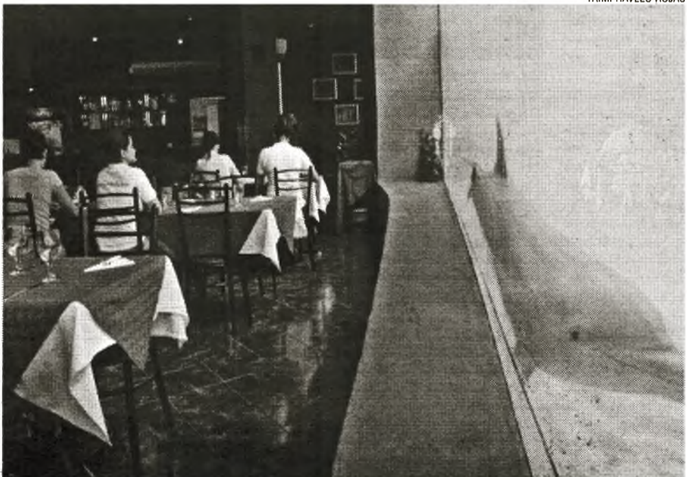
Im Restaurant „Gran Azul“ kann man während des Mittag- oder Abendessens die Unterwasserdarbietung mit Delfinen und ihren Trainern genießen