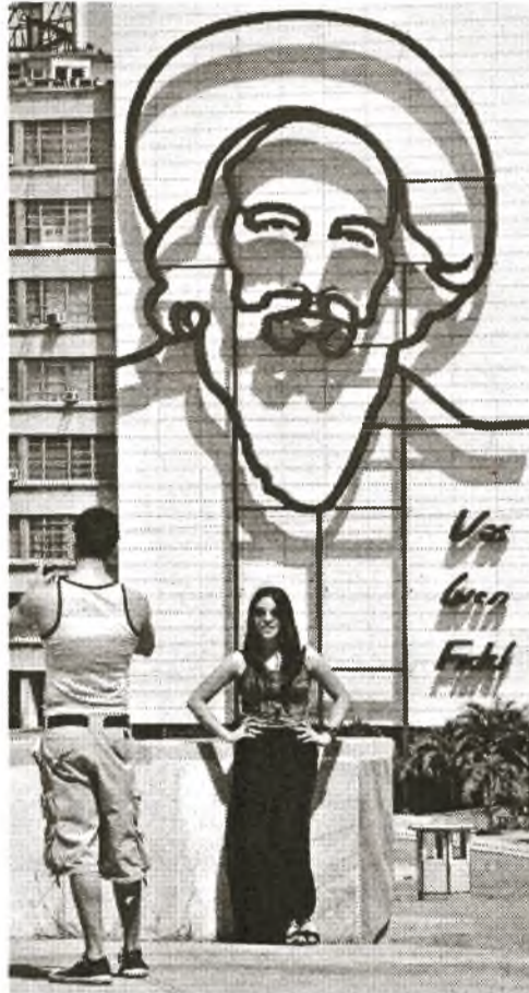
Ein Erinnerungsfoto auf dem Platz der Revolution. Im Hintergrund das Bild des legendären Guerillaführers Camilo Cienfuegos am Gebäude des Ministeriums für Kommunikation

Eine weitere Grundlage dieser Ergebnisse seien die Vielfalt des kubanischen touristischen Produkts, die Sicherheit, die unser Reiseziel bietet, und die Gastfreundschaft, die unser Volk darbringt, damit sich die Besucher wie zu Hause fühlen. •