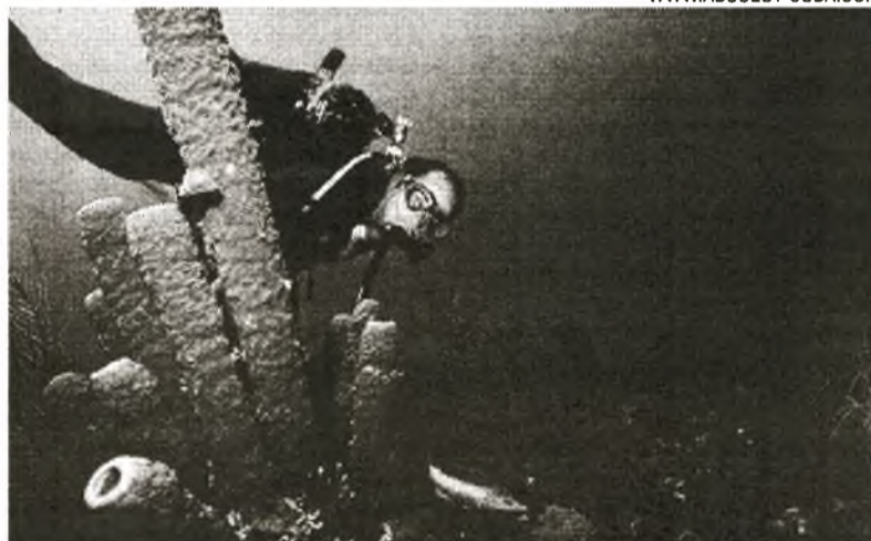
Das Internationale Tauchzentrum María La Gorda befindet sich auf der Halbinsel Guanahacabibes in der Provinz Pinar del Río

Bei einem Treffen mit Reiseveranstaltern und Journalisten hob der Manager hervor, dass für diese fünfte Ausgabe eine Rekord-Teilnahme in- und ausländischer Tau-