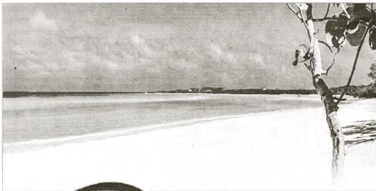
Einer der paradiesischen Strände von Jardines del Rey

Vom 5. bis zum 7. Mai beherbergt das weltweit größte Hotel der spanischen Kette Meliá Hotels International die Tourismusmesse FIT Cuba 2015. Italien wird in diesem Jahr der Ehrengast der Messe sein. Inhaltlich werden Wassersportangebote sowie die Jardines del Rey als Tourismusziel im Mittelpunkt stehen