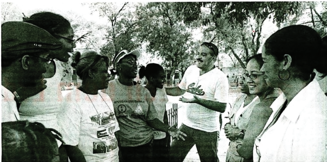
Die Ärztinnen aus den USA, Absolventinnen der ELAM, kamen in das Zelt-Krankenhaus, um gemeinsam mit den Kubanern Haiti zu helfen