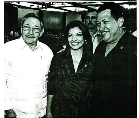
Nach der Begrüßung ließen sich Raúl und Chávez mit der vor kurzem gewählten Präsidentin von Costa Rica, Laura Chinchilla, fotografieren

Ein anderer, der sich von den Staatshäusern verabschiedete, war der ausscheidende costaricanische Regierungschef, Oscar Arias. Aus seiner Rede ließ sich ein gewisser Pessimismus hinsichtlich des neuen lateinamerikanischen und karibischen Bündnisses entnehmen. Außerdem gab es widersprüchlich Ausdrücke, da er unter einem gewissen Sofismus in Verteidigung der Demokratie Kriterien aufwarf, die Teilung säen und Konflikte augenscheinlich in Ländern fokussieren, die den größten ideologischen und politischen Widerstand gegen sein Handeln in diesen Jahren geleistet haben.