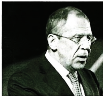
„Russland und Kuba sind den Ideen der Solidarität und der sozialen Gerechtigkeit verbunden“, sagte Außenminister Lawrow

Speziell zum Thema der Messe bemerkte Lawrow, dass Russland immer zu den größten Herausgebern von Büchern gehört habe, "das Wichtigste ist aber nicht die Menge, sondern der Wert, den das Buch in der Gesellschaft hat", als ein Kanal des Wissens und eine Quelle moralischer Gesundheit.