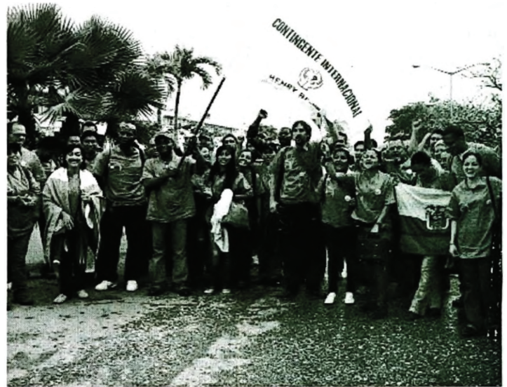
Die ersten 50 Ärzte der Gruppe der über 200 Absolventen der ELAM bei ihrer Ankunft in Haiti