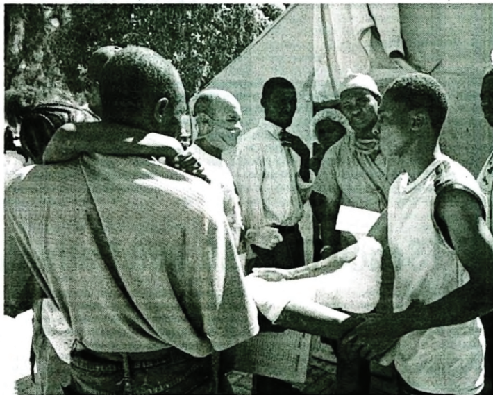
In dem Krankenhaus, in dem die Ärztinnen aus den USA ab heute arbeiten werden, sind schon 3.590 Patienten behandelt worden