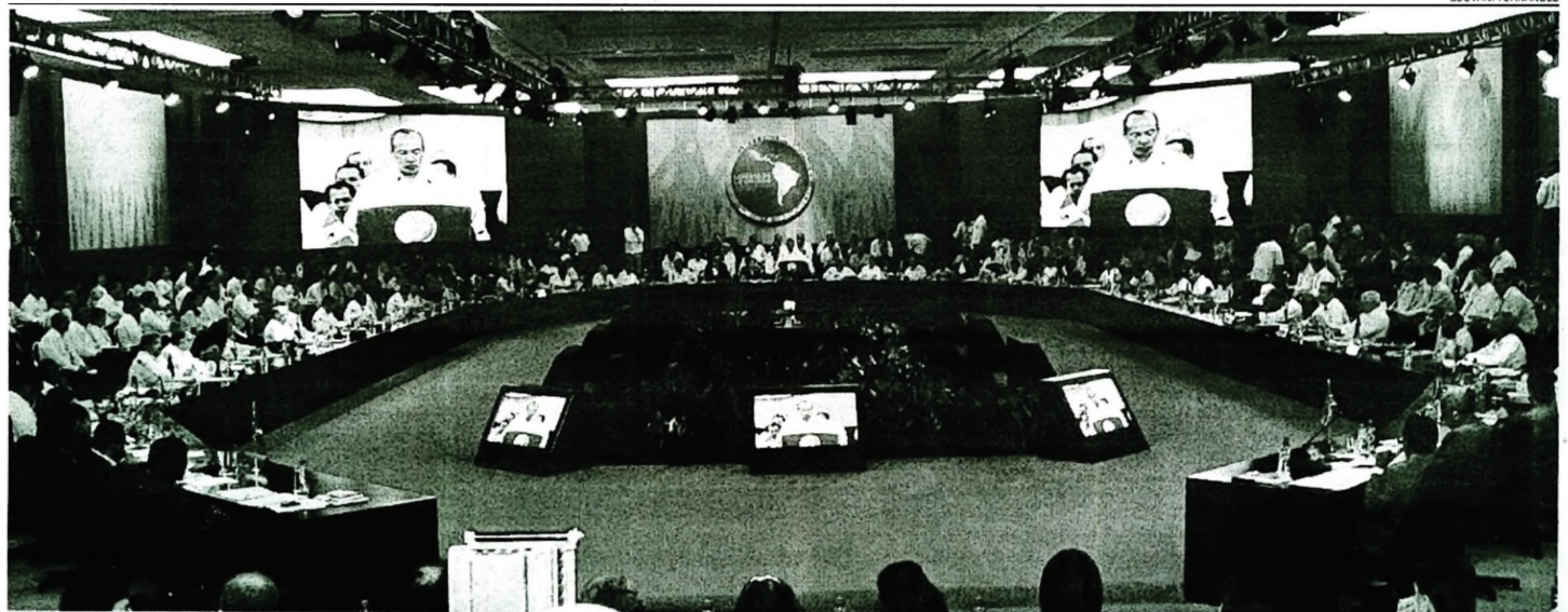
Tagung des Gipfels der Einheit Lateinamerikas und der Karibik

Nach Beendigung der Sitzungen musste die kubanische Delegation noch einige Zeit im Versammlungssaal verweilen, um mit verschiedenen Staats- und Regierungschefs zu sprechen, sowie anderen Persönlichkeiten, Angestellten des Saals, Begleitpersonal verschiedener Delegationen, die sich den Sitzen der Kubaner näherten, um zu grüßen, Meinungen auszutauschen oder ein Erinnerungsfoto des Gipfels mit dem Genossen Raúl zu machen. Fast als Letzte verließen der Armeegeneral und Präsident Chávez in anregender brüderlicher Unterhaltung den Ort, während sie von vielen Menschen begrüßt wurden, vom Sicherheitspersonal, Journalisten und Hotelangestellten. *