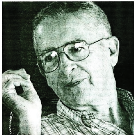
Ambrosio Fornet, Nationalpreisträger für Literatur 2009

Einige seiner Werke sind A un paso del diluvio (Einen Schritt vor der Sintflut); Antología de cuentos cubanos contemporáneos (Anthologie zeitgenössischer kubanischer Erzählungen); Cuentos de la