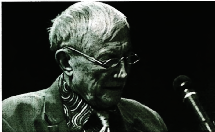
Jewtuschenko während der Lesung in der Festung Cabaña

Dann kam er 2006 zum Internationalen Lyrik-Festival nach Havanna, das damals der Dichtkunst der Sklavenkulturen gewidmet war. Hier