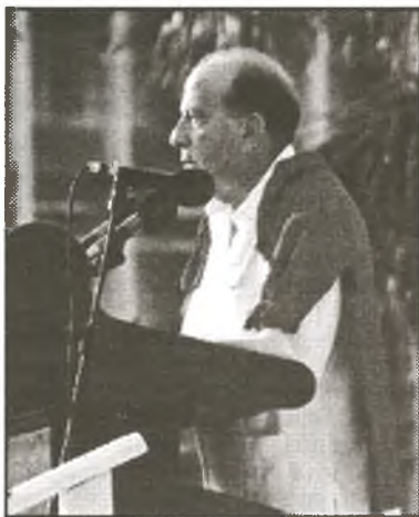
José Pablo González Casanova

Wir verfügen lediglich über unsere moralische Autorität, und aus ihr heraus appellieren wir an das Bewußtsein der Welt, eine neue Mißachtung der Prinzipien, die uns leiten, zu verhindern. Heute wird eine harte Kampagne gegen eine lateinamerikanische Nation geführt. Die Kampagne, deren Gegenstand Kuba ist, kann einer Aggression zum Vorwand dienen. Dem stellen wir die universellen Prinzipien der nationalen Souveränität, der Achtung der territorialen Integrität und des Rechts auf Selbstbestimmung gegenüber, die für das gerechte Zusammenleben der Nationen unerläßlich sind.