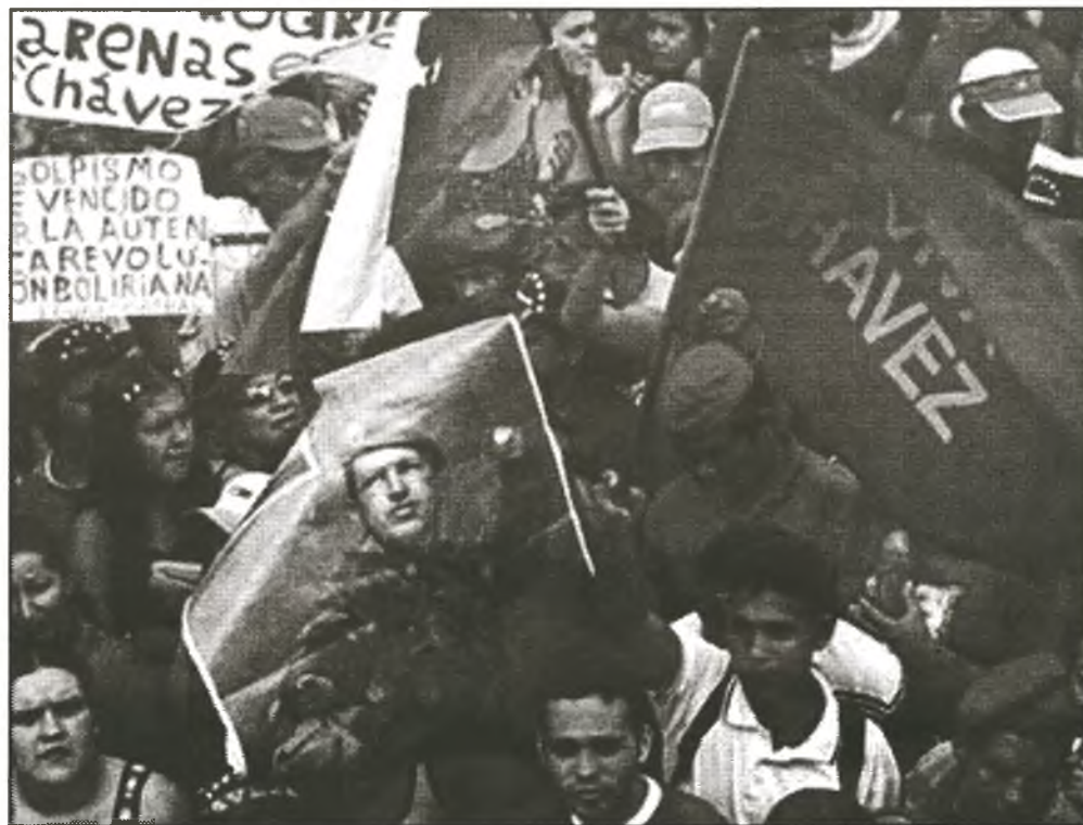
Zur Unterstützung von Chávez fand am 13. April in der Allee Simón Bolívar, in Caracas, eine Massenkundgebung statt

Entsprechend groß war das Interesse an einer Podiumsdiskussion zu diesem The-