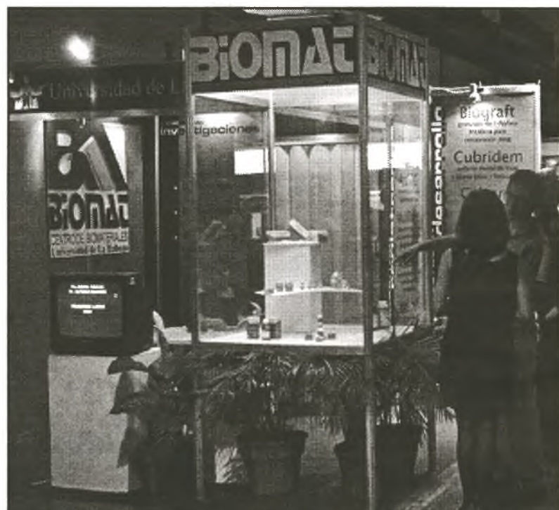
Das kubanische Unternehmen für Biostoffe BIOMAT stellt seine Neuentwicklungen vor