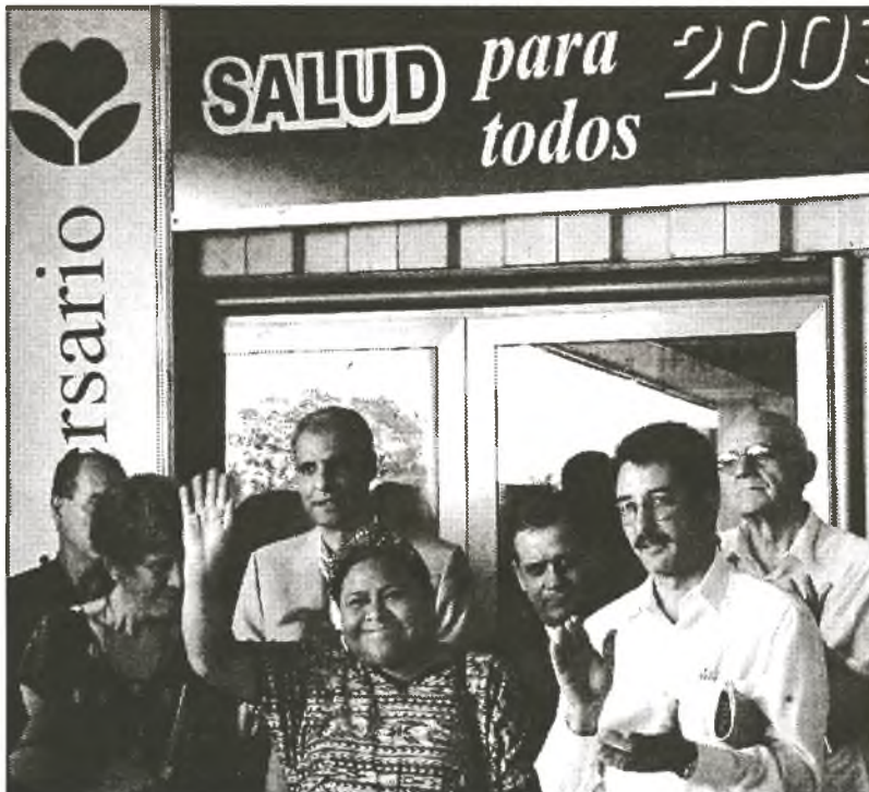
Rigoberta Menchú (neben Gesundheitsminister Damodar Peña) würdigt die kubanische Solidarität, die durch den Einsatz von Ärzten in anderen Ländern zum Ausdruck kommt und daß Jugendlichen der Dritten