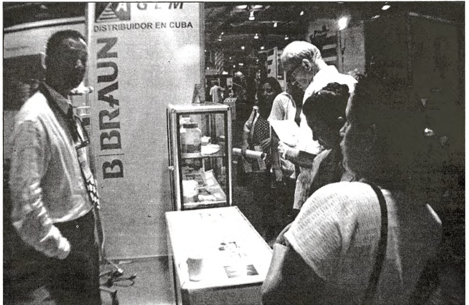
Unter den ausländischen Ausstellern sind die BRD, Spanien und Italien am stärksten vertreten. Hier der Stand der deutschen B/Braun

Von den kubanischen Unternehmen sind die Biologisch-Pharmazeutischen Laboratorien Labiofam