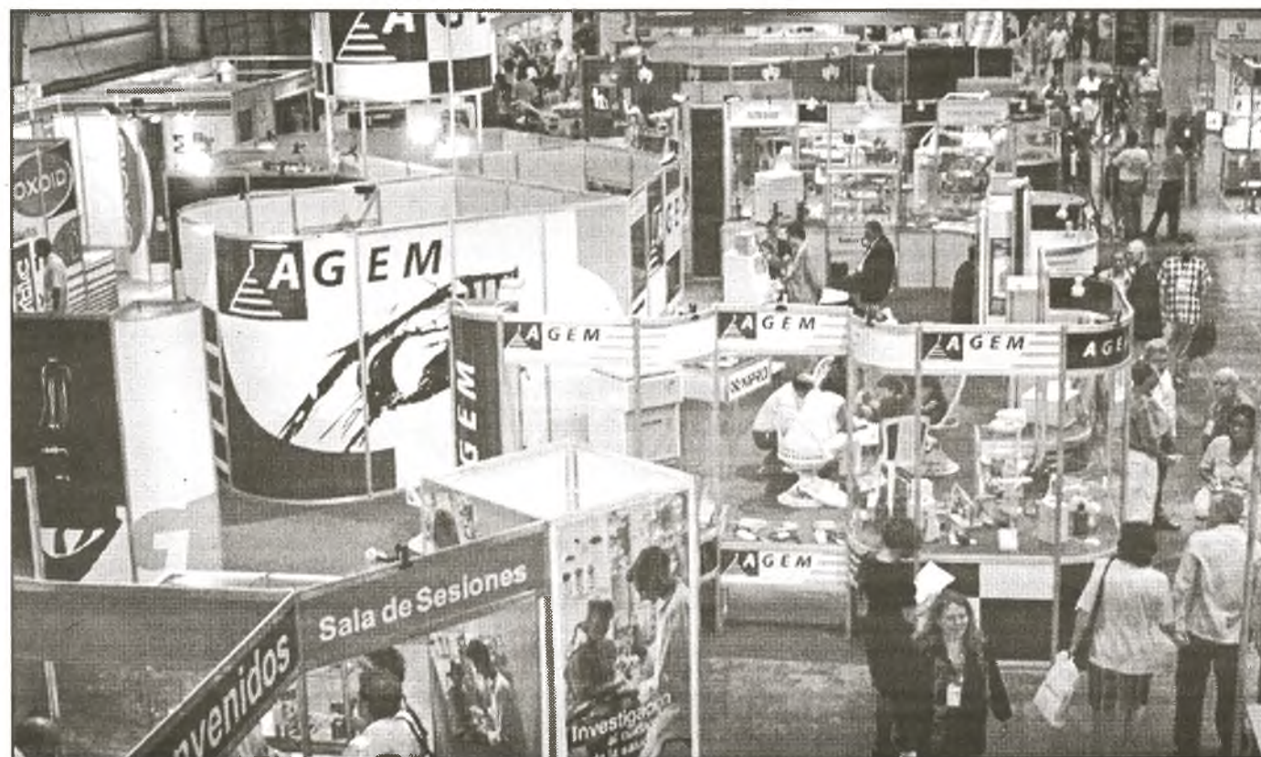
Das Messegelände PABEXPO in Havanna verfügt über eine Ausstellungsfläche von mehr als 1000 Quadratmeter

Sie lobte die Geste der Insel, die ihre Ärzte in anderen Ländern ein-