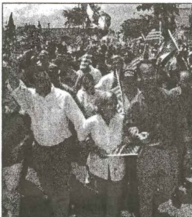
Die republikanischen Kongreßabgeordneten Ileana Ros-Lehtinen und Lincoln Díaz-Balart fordern schwerere Sanktionen gegen Kuba und waren darum in Genf präsent. Vor kurzem führten sie auch die ungewöhnliche Demonstration in Miami für den Krieg gegen den Irak an

Seine Organisation, die Unidad Cubana - (Kubanische Einheit), vereint mehrere Gruppen, die irgendwie mit dem Terrorismus gegen Kuba verbunden sind. Permy