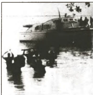
Landung der Granma in Las Coloradas