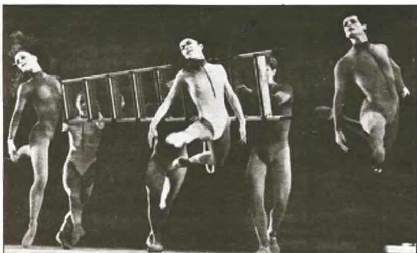
"Bach Con-Cierto" der Komischen Oper Berlin, eine Welturaufführung für das Festival