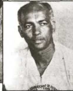
José Francisco Reinoso, Präsident des kubanischen Fußballverbandes

Spiele im Ausland ermöglichen, damit wir, die Spieler, an Erfahrung gewinnen und vor allem an Geschicklichkeit, an der es uns so sehr fehlt. Die Spieler müssen lockerer werden, damit sie eine andere Spielqualität erreichen und wirklich nach großartigen Ergebnissen streben können."