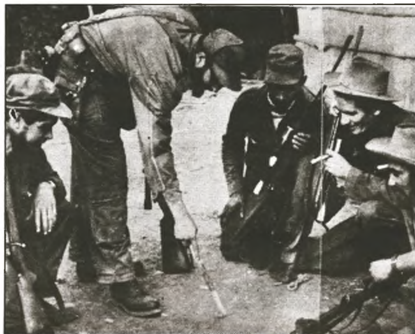
Fidel, Che, Calixto Garcia, Ramiro Valdés und Juan Almeida, fünf der Mitglieder der Granma-Besatzung in der Sierra Maestra

Vierzig Jahre danach scheint all dies noch immer unmöglich: der ganze verschwörerische Mechanismus der Auswahl der Männer und ihre Ausbildung in Mexiko; das Aufrechterhalten der Verbindungen zu den übrigen revolutionären Kräften inner- und außerhalb Kubas; der Kauf von Waffen, die unglaubliche