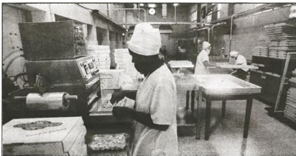
Verarbeitungsanlage von Teigwaren mit neuer Technologie, die Zulieferer von Finatur erworben haben