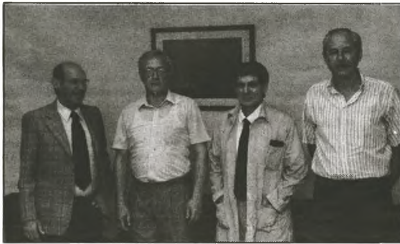
IM INTERNATIONALEN ZENTRUM FÜR NEUROLOGISCHE RESTAURATION

"Der ständige Schmerz schien zu meinem täglichen Leben zu gehören", sagt er. "Dafür gibt es keine Heilung", wiederholten die befragten Ärzte immer wieder.