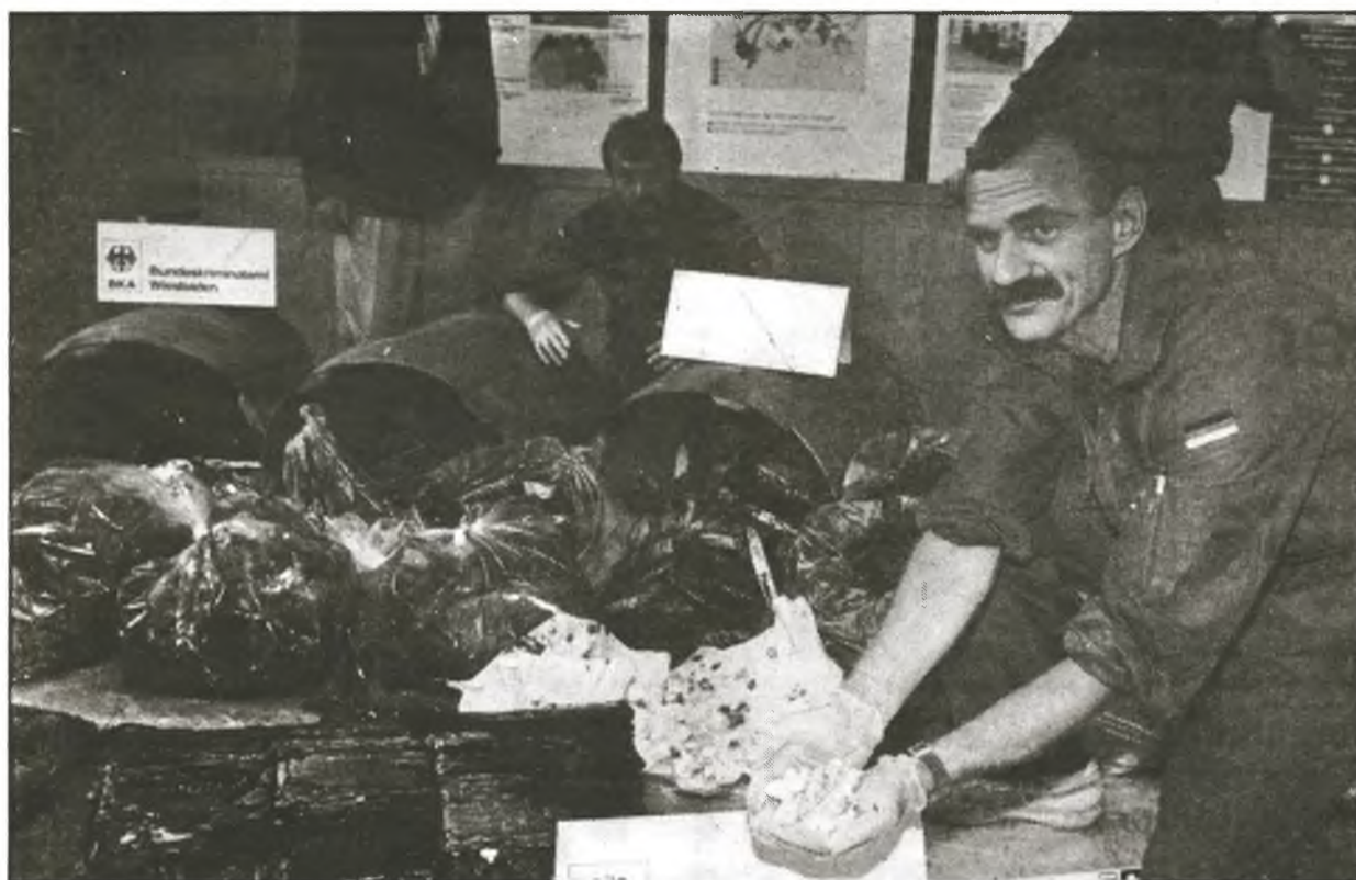
Die Europäische Union zeigt sich besorgt, denn ihre Länder stellen ein vorrangiges Ziel für die Drogenhändler dar