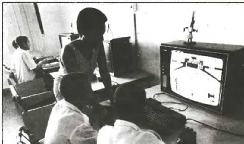
Das Leben in diesen Heimen unterscheidet sich kaum von dem anderer kubanischer Schulen, weil Lehrer des MINED mit Spezialausbildung den Unterricht geben

In der schwierigen Lage, die die Insel nach der Auflösung des sozialistischen Lagers und aufgrund der immer enger werdenden wirtschaftlichen Umzingelung durch die USA durchlebt, ist besonders stark das Bild bettelnder Kinder auf den Straßen wieder aufgetaucht, das seit dem revolutionären Sieg von 1959 ausgemerzt worden war.