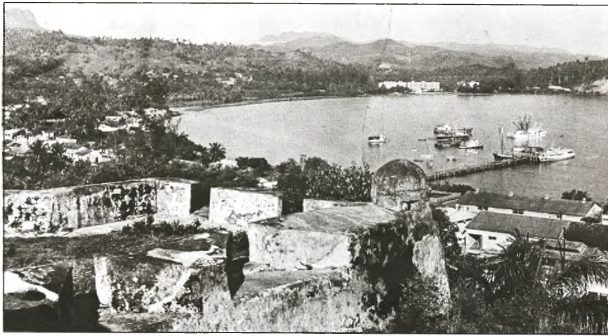
Baracoa, erste Ansiedlung des Landes und Region reich an Kakao, Kaffee und Kokosnüssen.