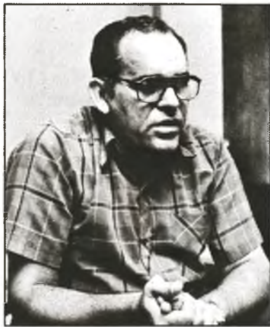
Rider Díaz Leyva, Erster Sekretär der Partei der Provinz, sieht in der Abwanderung der Bevölkerung aus den Bergen in die Stadt eines der größten Probleme der Region

- "Wo kein Wasser ist, wird es gebraucht, und wo zu viel davon ist, gibt es keine Verwendung dafür."